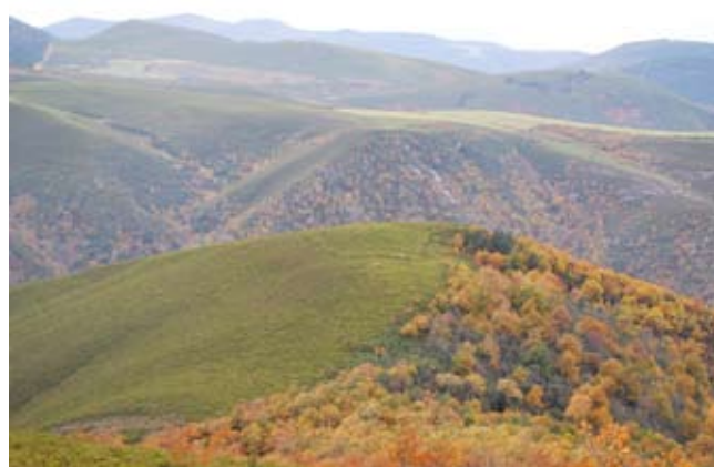
FIG.4: Vista de la ubicación del recinto de A Recacha.

llega hasta 1 m de altura en la cara noreste del recinto. En planta, el recinto dibuja un perímetro irregular adaptado a la topografía del terreno que mantiene en lo posible trazados rectos y esquinas curvas, de acuerdo con los preceptos constructivos de los castra aestiva altoimperiales.