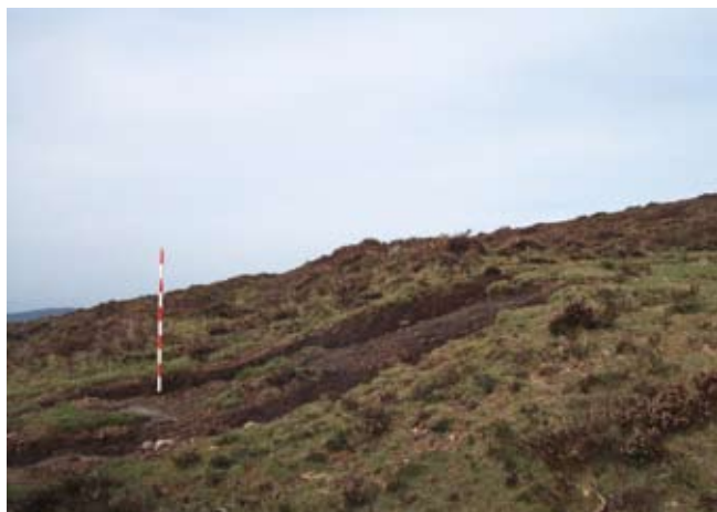
FIG.5: Talud occidental de A Pedra Dereta, afectado por rodadas de vehículos.

forma como las dimensiones responden a las características de una clavicula para reforzar la protección del acceso, característica constructiva propia igualmente de los recintos campamentales altoimperiales (Reddé 1995).