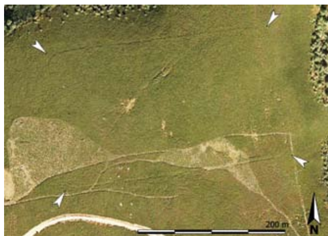
FIG.3: Planta de A Granda das Xarras.

La estructura dibuja una planta irregular con unas dimensiones máximas de 150 m de longitud en el eje NE-SO y 60 m en el eje NO-SE, encerrando una superficie de 0,7 ha. La principal evidencia del yacimiento es un talud perimetral de composición terrera y una altura variable que