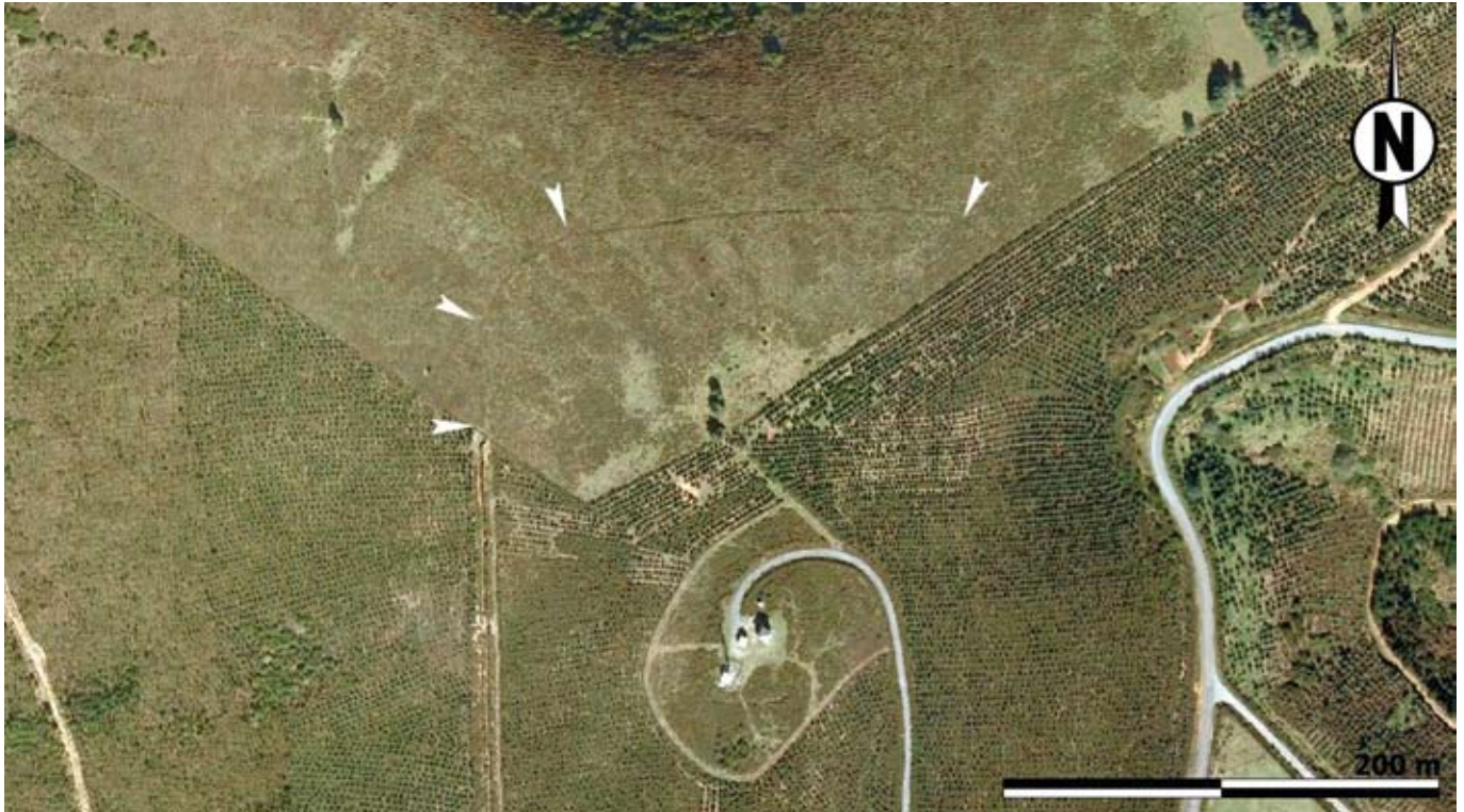
FIG.6: Vista aérea del único tramo de talud conservado de El Pico el Outeiro, en su extremo septentrional (foto: PNOA, www.ign.es/PNOA/ ).

allá de los campamentos que centran nuestra atención en este artículo hay que reseñar el caso de Moyapán, cuya comunicación a la Consejería de Educación, Cultura y Deporte evitó que se viera afectado por una pista y un aerogenerador, con lo que se favoreció la apertura de un sondeo arqueológico que constató su naturaleza militar romana (Blanco Vázquez et al. 2012).