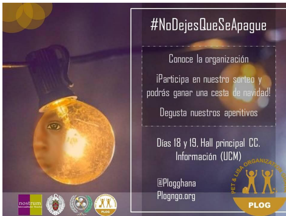
Imagen de la campaña de captación de fondos para la ONG Pet & Lisa Organization Ghana, diciembre 2017.