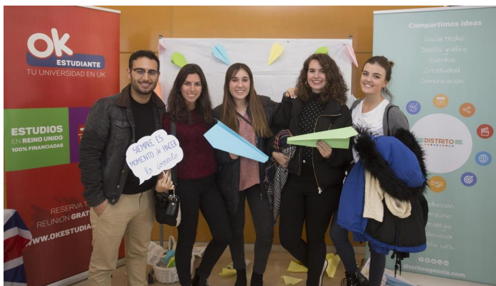
Imagen del evento de liderazgo organizado por los alumnos, diciembre 2017. (Imagen reproducida con la autorización de los alumnos).