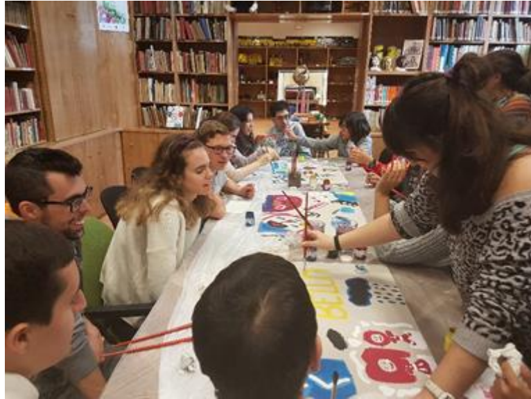
El taller “La belleza es infinita”, participantes en plena actividad creativa (Imagen reproducida con la autorización de los participantes).