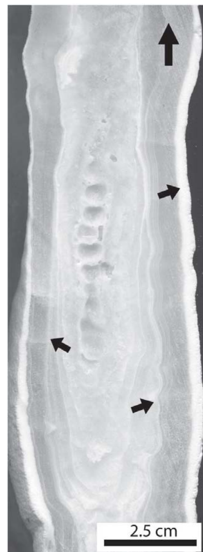
Fig. 2.- Muestra de mano de uno de los espeleotemas que muestra internamente algunas líneas de micritización (ver flechas) y una cubierta externa blanca y mate, también micritizada.

En la cueva de Castañar de Ibor el aragonito se presenta de varias formas: a) como cristales aciculares de hasta 5 mm muy finos que nacen de un punto y crecen formando agregados fibrorradiados. Estas formas pueden llegar a los 3 cm de diámetro y siempre aparecen nucleadas en las arcillas; b) en las estalactitas se dispone radialmente a partir del canal central de modo que en lámina delgada aparece como finos cristales en abanico que pueden no conservar la mineralogía original; c) otra forma de aparición muy