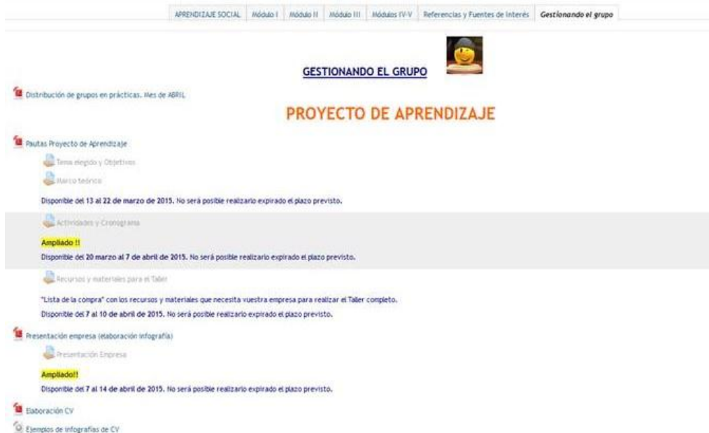
Figura 2 Espacio de trabajo diseñado sobre plataforma Moodle 2.0 para el alumnado de Psicología del Aprendizaje (Grado de Pedagogía M1 y M2).