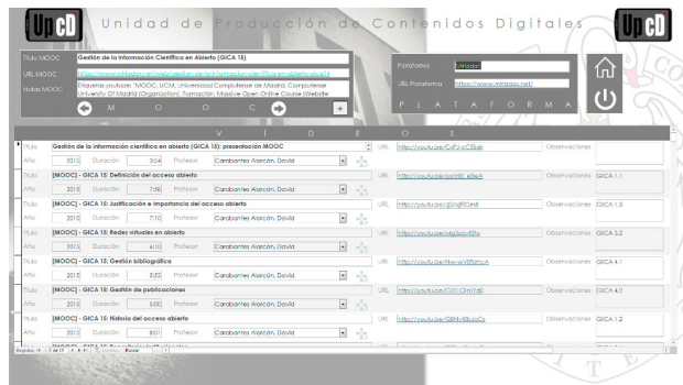
Base de datos UCD

La información de los vídeos se agrupará bajo el registro de su correspondiente MOOC, en el que se guardará la información relativa a la plataforma en la que se imparte, la URL, las etiquetas o palabras clave utilizadas para su descripción y la URL de la lista de reproducción que contiene todos los vídeos. Por último, se almacenan los datos de contacto de los profesores, su filiación y el cargo con el que desean aparecer en rótulos y créditos.