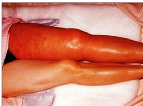
Figura 2.- Características clínicas de la trombosis venosa profunda

Una vez que se va desplazando a las arterias pulmonares, dependiendo del tamaño del émbolo, se precipitaran los siguientes síntomas o resultaran fisiológicamente insignificantes y asintomáticos (émbolos de pequeño tamaño). Los émbolos más grandes dan lugar a disnea aguda (de esfuerzo o intermitente) o dolor torácico pleurítico.