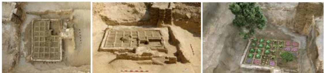
Jardín funerario de la necrópolis de Tebas (Luxor) descubierto por el equipo de investigación del Proyecto Djehuty del CSIC. Reconstrucción del jardín.

De forma particular se han revisado dos aspectos: su caracterización como obra de arte y su potencial como fuente de conocimiento histórico. En relación con la primera cuestión se ha comprobado que es factible establecer una taxonomía muy completa del jardín desde el punto de vista del análisis artístico. En cuanto a la información histórica que estos contienen, parece difícil obviarla. Ponemos como ejemplo uno de los primeros jardines de los que tenemos constancia y cuyo descubrimiento data de hace apenas un año: el jardín funerario de una tumba de la dinastía XII localizado en la necrópolis de Tebas.