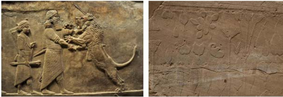
Relieve del palacio de Asurbanipal en Nínive: cacería de leones (S. VII a.C.) (CC)Wikipedia. Relieve del Akhmenu de Tutmosis III en Karnac: figuras botánicas (S. XV a.C.) Imagen de Aroa Velasco.

Pero el jardín no solo representa con eficacia el concepto de poder, sino que permite mostrar el lugar que se quiere ocupar en la sociedad: los jardines se convierten en espacios para la ostentación en primer lugar de las clases privilegiadas más próximas al poder, pero también de la burguesía, que se ocupará de hacer visible y tangible su ascenso social. Duby (2001), señala que la riqueza material funcionaría en realidad como reflejo de la virtud o excelencia moral inherente de su poseedor. Una lógica que, como muestran estudios como el de García-Entero (2004) o multitud de escritos de época clásica (Marcial, Plinio), funciona en los jardines romanos que se convirtieron en uno de los escenarios fundamentales para el desarrollo de la vida social. El trabajo de Gracia (2007) muestra también que las familias japonesas que disponían de medios económicos se construían sus propios paraísos. Otros ejemplos paradigmáticos los encontramos en Europa a partir del renacimiento, como la Villa Quaracchi, propiedad del banquero Giovanni Rucellai, de la que destacamos la elección de su ubicación pues, como afirman Taffuri (2012) y, según este, el propio Rucellai, fue edificada en lo alto para ser admirada inmersa a sus jardines. O la Villa d'Este, donde el protagonismo concedido al jardín resulta claro.