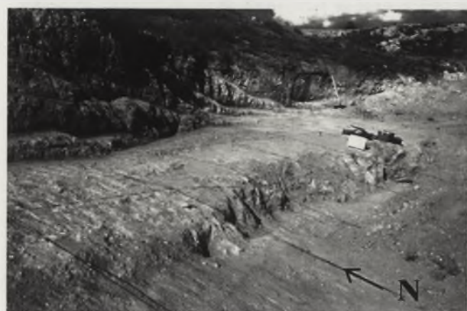
FIGURA 1. Excavación de Toril 3A. Cuadrícula y cuadros excavados en las distintas campañas. A la derecha aspecto de la excavación a comienzos de la campaña de 1999, son visibles los cuadros Z0-Z1 a D0-D1.