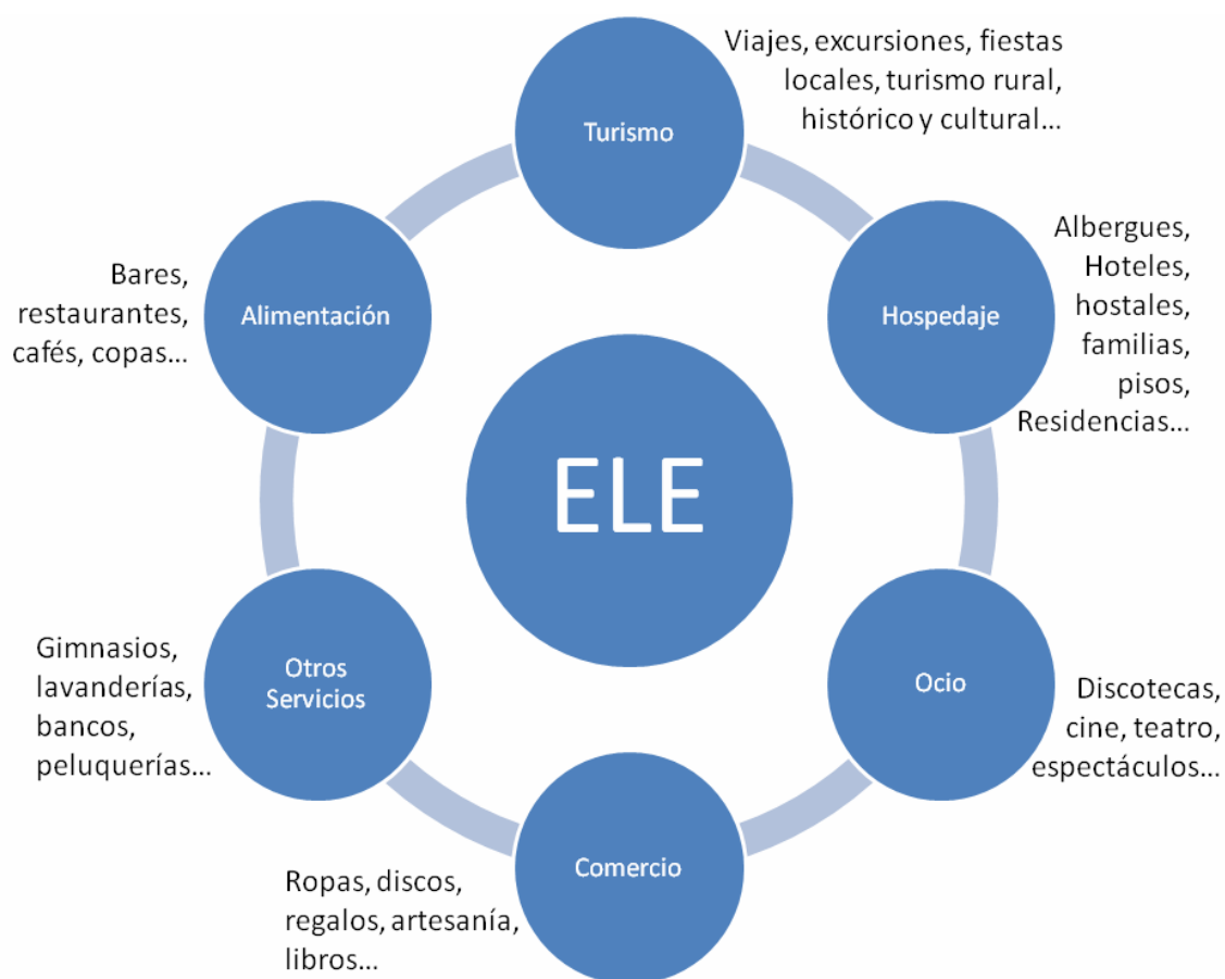
Figura 2 – Sectores económicos complementarios al cluster de ELE en Salamanca

Elaboración propia con base en Bombarelli et al (2008)