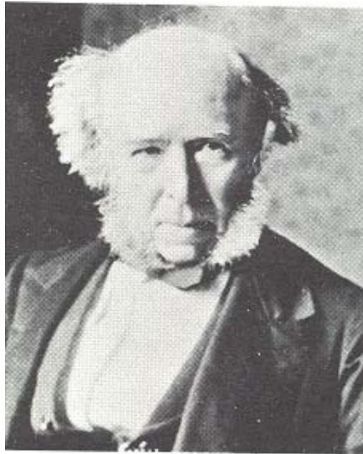
• Herbert Spencer