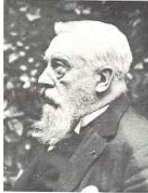
• Gustave Le Bon