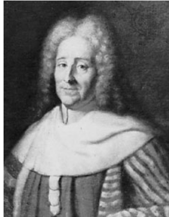
Charles-Louis de Secondat, barón de Montesquieu