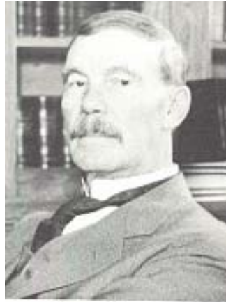
• Edward A. Ross