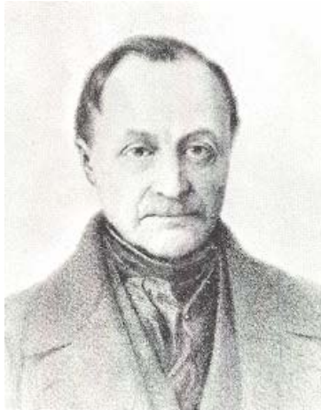
• Auguste Comte