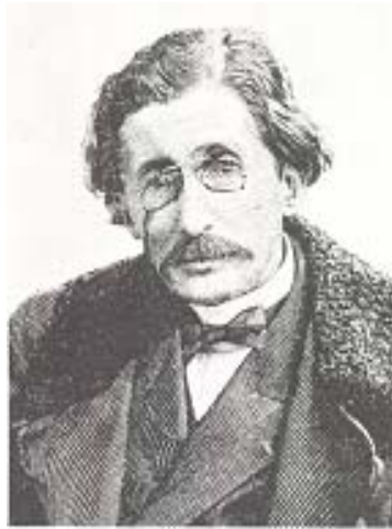
• Gabriel Tarde