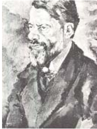
* Max Weber