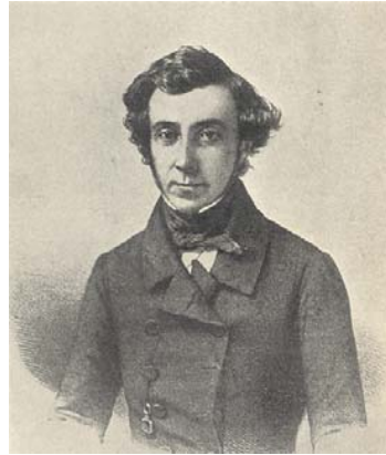
Alexis de Tocqueville