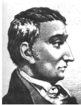
Claude-Henri, conde de Saint-Simon