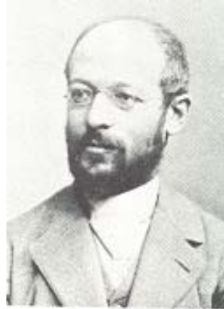
• Georg Simmel