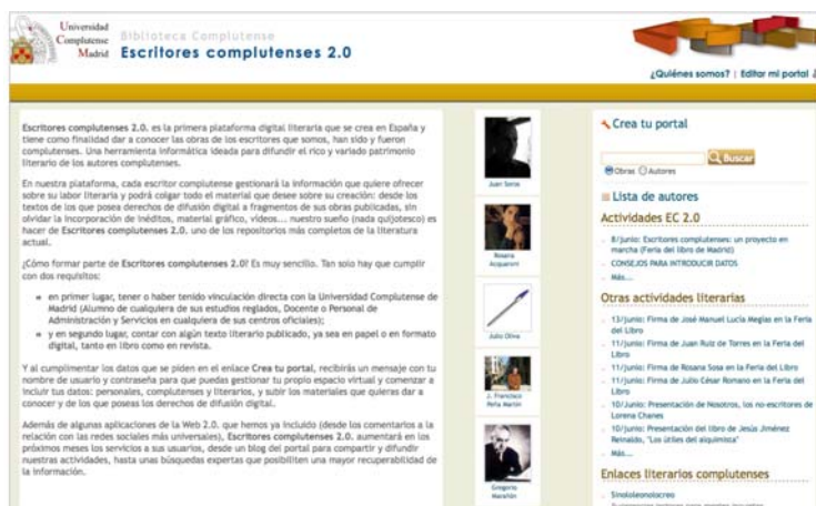
Imagen 1: Nodo inicial de EC 2.0

los propios autores gestionarán su información y los textos y materiales que quieren ofrecer a sus posibles lectores; plataforma digital que ofrecerá a los usuarios, autores y lectores, diversas utilidades tanto para la recuperabilidad de la información como para la comunicación con y entre los autores [imagen 1].