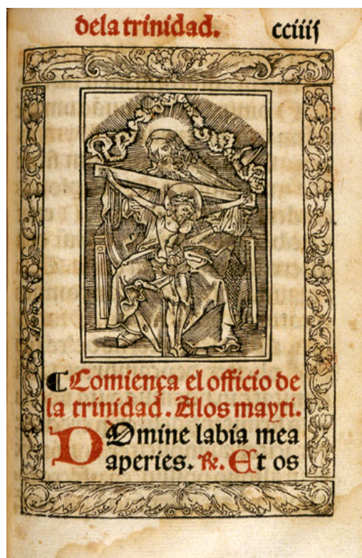
Fig. 5: Horas de nra. Señora según la orden Romana. Zaragoza. Pedro Bernuz & Bartolome de Najera. 1547, 9 agosto, f.CCIIII r.