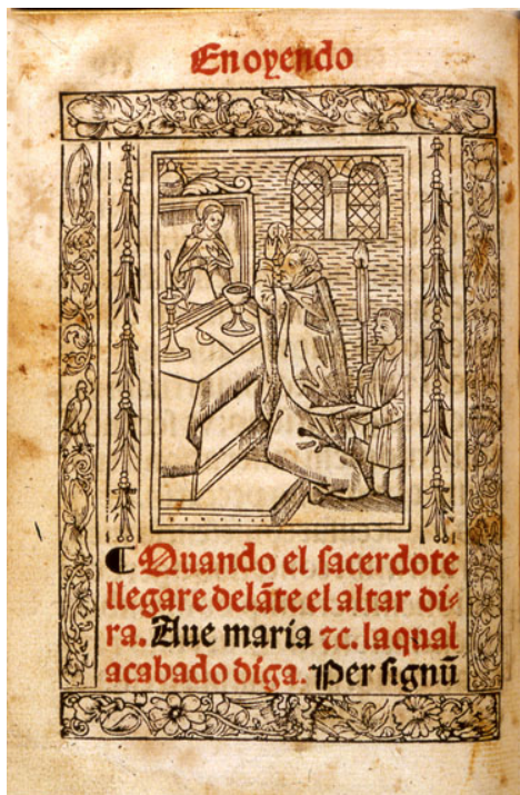
Fig.3: Horas de nra. Señora según la orden Romana. Zaragoza. Pedro Bernuz & Bartolome de Najera. 1547, 9 agosto, f. XLV v.