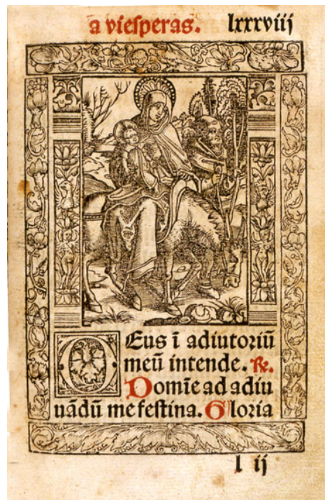
Fig. 4: Horas de nra. Señora según la orden Romana. Zaragoza. Pedro Bernuz & Bartolome de Najera. 1547, 9 agosto, f. LXXXVIII r.