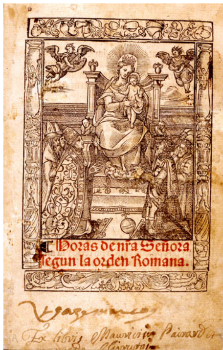
Fig. 1: Horas de nra. Señora según la orden Romana. Zaragoza. Pedro Bernuz & Bartolome de Najera. 1547, 9 agosto. Portada