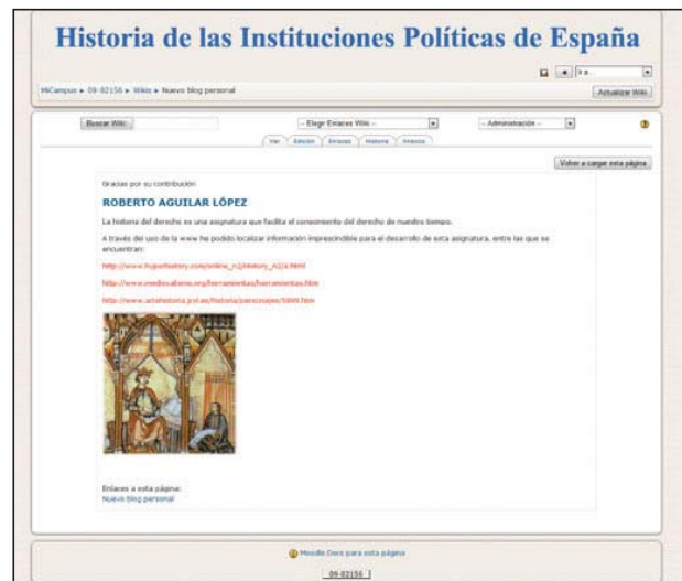
Figura 3. Ejemplo de uno de los blogs de clase

Tras haber implementado, entre otras actividades didácticas, el ejercicio del trabajo colaborativo en algunas asignaturas que forman parte del área de la Historia del Derecho y de