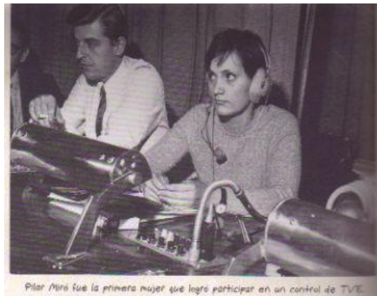
Pilar Miró fue la primera mujer que logró participar en un control de TVE.

Pilar Miró en la sala de control de TVE.