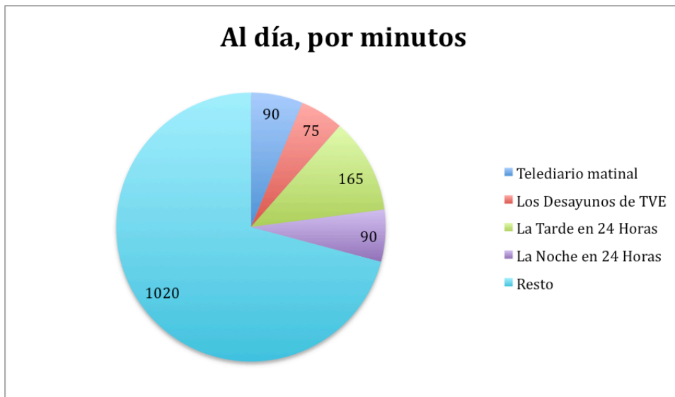
Gráfico II. Tiempo dedicado a los cuatro programas principales y al resto.

Canal 24 Horas no emite los fines de semana sus cuatro principales programas, por lo que la parrilla pasa de mixta a fragmentaria. El promedio de minutos por programa apenas rebasa la media hora. De 51,8 minutos promedio por programa de lunes a viernes, pasa a 35,1 los fines de semana, con una programación basada en ruedas informativas, espacios temáticos breves y repeticiones.