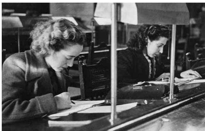
Fig. 9. Mujeres lectoras

título que se expedía en la Escuela era conditio sine qua non para poder acceder al Cuerpo Facultativo (cf. Peiró y Pasamar, 1996; Almagro, 2007: 13-32). Después de su desaparición, algunas de sus enseñanzas, como la Bibliografía o la Paleografía, fueron a parar a la entonces Universidad Central (vid. Simón, 1976: 17-31; Clemente, 2007: 201-211; Francisco, 1998: [129]-136), donde ya antes habían estado presentes, como «estudios de erudición», en el fugaz plan general de Instrucción Pública aprobado por el Real Decreto de 4 de agosto de 1836 (Fernández, 2001: 89-90). Desde entonces, muchos filólogos e historiadores, fundamentalmente, aprendieron —y lo siguen haciendo— las tareas bibliográficas, archivísticas y paleográficas (vid. Fernández y Rokiski, 2008: 366-373).