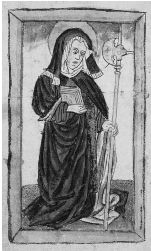
Fig. 3. Santa Wiborada