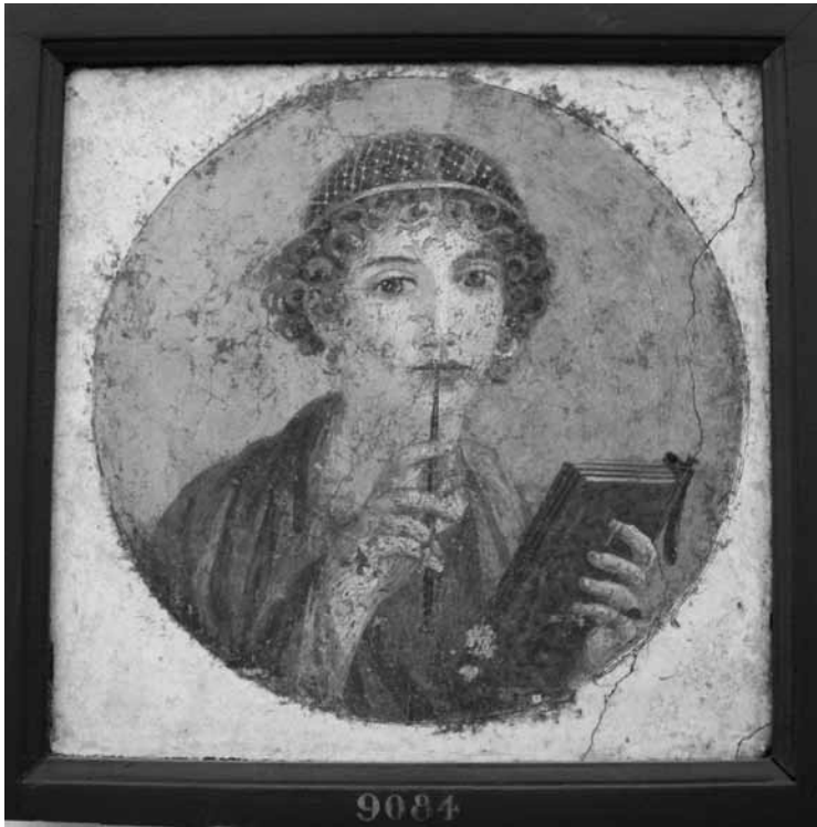
Fig. 1. Saffo

Pero en un contexto diferente a este, el grecorromano, el más estudiado de la Edad Antigua respecto a las bibliotecas se refiere, no parecen haberse dado muchos casos. De hecho, durante la Edad Media, al erigirse las bibliotecas en los monasterios ( vid. Labarre, 2002: 27-39; Dahl, 1999: 44-89), mayoritaria y fundamentalmente masculinos, hay pocas evidencias conocidas —al menos por quien escribe estas líneas— de mujeres copistas, miniaturistas o bibliotecarias que trabajasen en los scriptoria . Tal vez, porque ciertamente no se dieron, o porque los dechados femeninos a este respecto fueron deliberadamente ignorados, y con el tiempo inexorablemente olvidados.