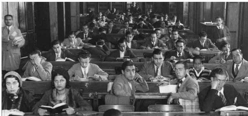
Fig. 6. Menos lectoras que lectores

A la par, por iniciativa de los mismos nombres —entre los que destacan Eugenio de Ochoa del Ministerio de Gracia y Justicia; Pascual de Gayangos de la Real Academia de la Historia; y Alonso Martínez y Claudio Moyano del Ministerio de Fomento—, se creó la Escuela de Diplomática el 7 de octubre de 1856, a la que un año después se le confirió el carácter de Superior; inspirada en los dechados de los vecinos lusos y galos. Dicho de otra manera, esta institución era la que habilitaba a sus egresados para desempeñar las funciones y facultades en la Administración Pública, lo cual empezó a ocurrir en 1859, con la graduación de su primera promoción.