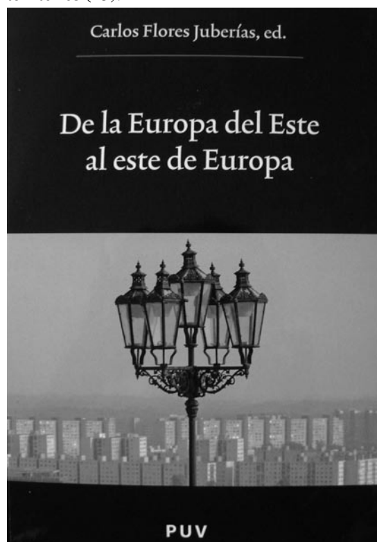
Foto 01. Carlos Flores Juberías (Ed.), De la Europa del Este al este de Europa: actas del IV Encuentro Español de Estudios sobre la Europa Oriental (Valencia del 22, 23 y 24 de noviembre de 2004), Universidad de Valencia, Valencia 2006.

también en España el tema que recibe más dedicación, tanto por parte de los historiadores como por parte de los politólogos y sociólogos. Para la comprensión del papel desempeñado por el nacionalismo en la disolución de la URSS fue fundamental la divulgación en España del libro de la mencionada Hélène Carrère d'Encausse El triunfo de las nacionalidades: el fin del imperio soviético (24). Cuando la cuestión clave para la comprensión del colapso de la URSS parecía ser la ineficiencia económica, Carrère d'Encausse popularizó la idea de que había sido la disparidad cultural y nacional de la Unión Soviética uno de los elementos clave para su fracaso final. Sea o no cierta esta afirmación, lo importante aquí es la recepción que tal propuesta de interpretación tuvo en una España obsesionada por dichas cuestiones. Se puso de manifiesto, en este sentido, la escasa coherencia interna del régimen soviético en materia política y la poca viabilidad que había resultado tener el concepto de «ciudadanía soviética» frente a otras realidades más profundamente arraigadas en las diversidad de sociedades que conformaban la URSS. No sólo en España, sino sobre todo en otras historiografías occidentales se desarrolló un interés creciente por conocer esa diversidad regional que había permanecido oculta y detrás de la que se hallaban fenómenos como la pervivencia de la religión musulmana en un régimen soviético (en las repúblicas asiáticas) o de las costumbres tribales en algunos territorios (25).