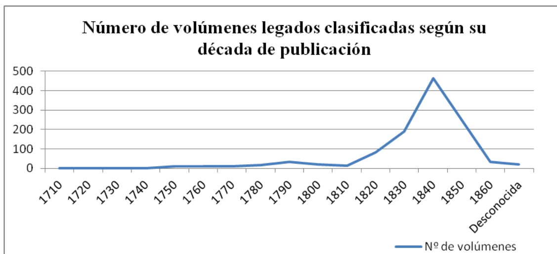
Gráfico 1: Número de volúmenes legados clasificados según su década de publicación.