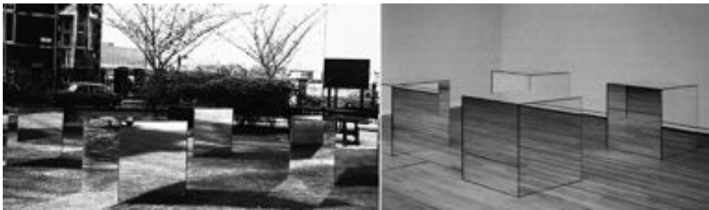
Fig. 4. Robert Morris, instalación Cubos , 1965.

Ocurre lo contrario con los Cubos (1965, fig. 4) de Robert Morris (Missouri, 1931) pues éstos destronan al sujeto como punto central fijo del espacio infinito de Fabro. Los cubos de Morris cobran sentido desde el lugar que ocupan y no desde la mirada del sujeto que los percibe; es, entonces el lugar , el protagonista que hace y deshace al objeto; y así vemos como los cubos se mimetizan y tan pronto son suelo de madera aquí o hierba verde allá, son todo y son nada al mismo tiempo, son esto, y también son aquello, y actúan más que como pantallas de una mimesis aristotélica, como contenedores que atrapan el espacio que ocupan. Y en tanto que se mimetizan completamente con su entorno, se vuelven invisibles. Se trata pues, de una mimesis del lugar que niega su localización y que expulsa al sujeto como constructor de espacios y de realidades; tanto el sujeto como las cosas son así interpretados como meros productos de la ilusión. Morris abrió camino a obras más actuales como Follow Me (2009) de Jeppe Hein (Copenhague, 1974), quien construye un verdadero laberinto para la mirada cartesiana en la instalación de espejos permanente que hizo para la Universidad de Bristol (Fig. 5). Cuando los árboles del Royal Fort House se reflejan en los prismas de espe-