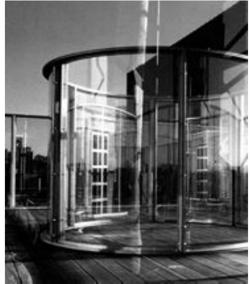
Fig. 8. Dan Graham, Instalación en la azotea del Dia Center for the Arts , Nueva York, 1989.

La obra, pues, consiste en mirarse mirando dentro de un paisaje que abre su horizonte 360° y está construido a base de reflejos que se