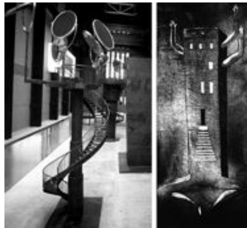
Fig. 2. Louise Bourgeois, (a la izquierda) Hacer, Des-hacer y Re-hacer , Instalación en la Modern Tate Gallery, 2000; (a la derecha) Mujer-Casa , óleo y tinta, 1946-47.