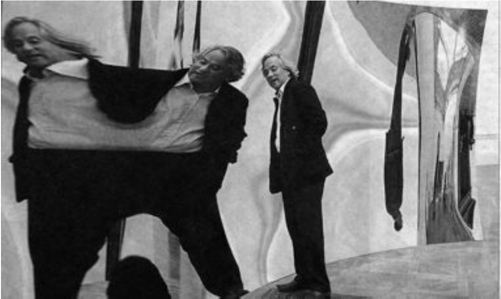
Fig. 6. Anish Kapoor, Vertigo , 2006 (foto El País , 10/10, 2009).

aquello que consciente (y casi siempre) inconscientemente relacionó 25 . En este sentido cabría entonces interpretar esa mirada lacaniana como una mirada que podríamos llamar “panegocéntrica” y radicalmente (por no decir, enfermizamente) antropocéntrica 26 . El “yo”, al fin y al cabo, no es más que un “modificador lingüístico” vacío 27 porque, como el espejo, contiene aquello que refleja a cada momento, de ahí que su referente sea por naturaleza indeterminado: “Yo”, “tú”, “él”... no son más que situaciones desde donde el sujeto mira y se posiciona con respecto a las cosas. Si nos construimos en base a estos contenedores vacíos, a estas formas meramente lingüísticas, quedamos atrapados dentro de un laberinto de reflejos interminable donde no vemos sino fragmentos perdidos de nosotros mismos a cada momento. Liberados de ser meros “modificadores lingüísticos”, podemos acceder a “otras realidades” que encierra también el espejo como no-lugar.