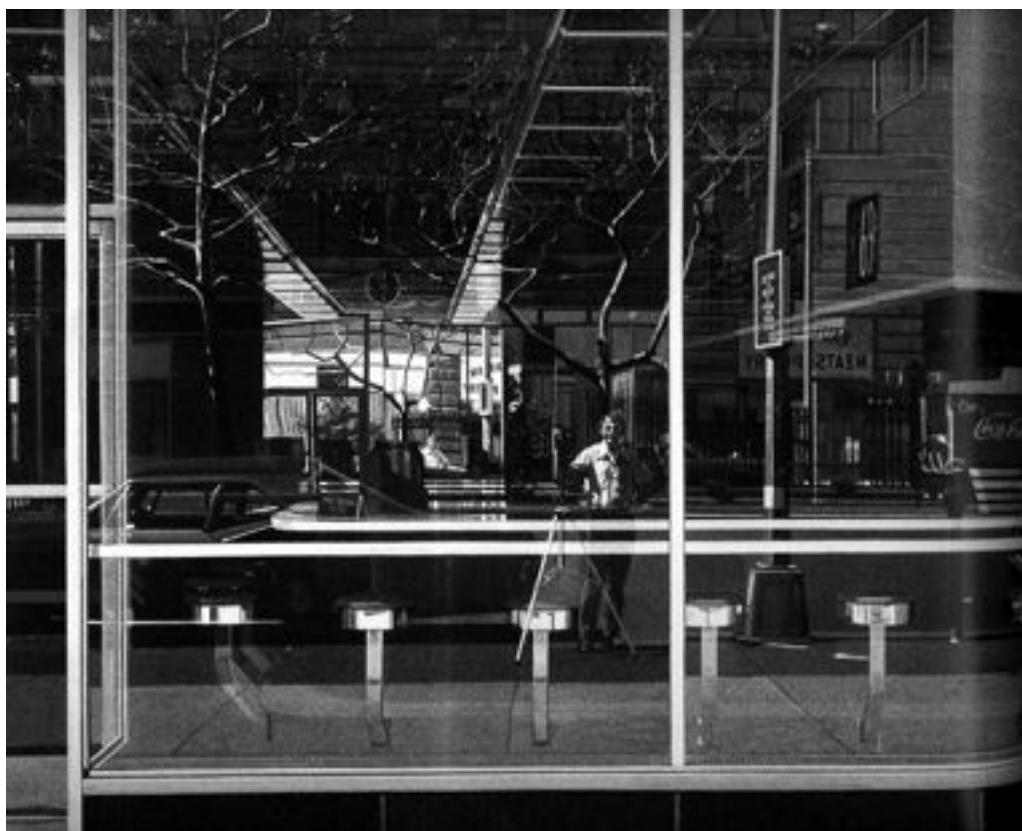
Fig. 9. Richard Estes, Doble Autorretrato (detalle), 1976.

ferenciada por la cual se fusionaban dos sujetos en uno. Y esta misma mirada nos remite ahora a una percepción en la que difícilmente podemos separar el conocimiento del conocedor. Y gracias a ello, el espectador deja de serlo, sale de sus confines cerrados, liberándose de la tiranía que impone el pensamiento dual y binario 31 . Ese cristal de escaparate pintado (no deja de ser irónico que la técnica sea tan tradicional) funciona como un nuevo interfaz, en donde lo que está dentro y lo que está fuera, así como la propia imagen del perceptor, aparece simultáneamente en un espacio no ordenado según las coordenadas euclidianas; no hay sólo un punto de fuga, ni un lejos ni un cerca, sino pura simultaneidad. En este caso se desvanecen las rígidas fronteras que marcan la estructura dual del acostumbrado y aprendido sistema perceptivo que es egocéntrico y propone una mirada desdiferenciada que