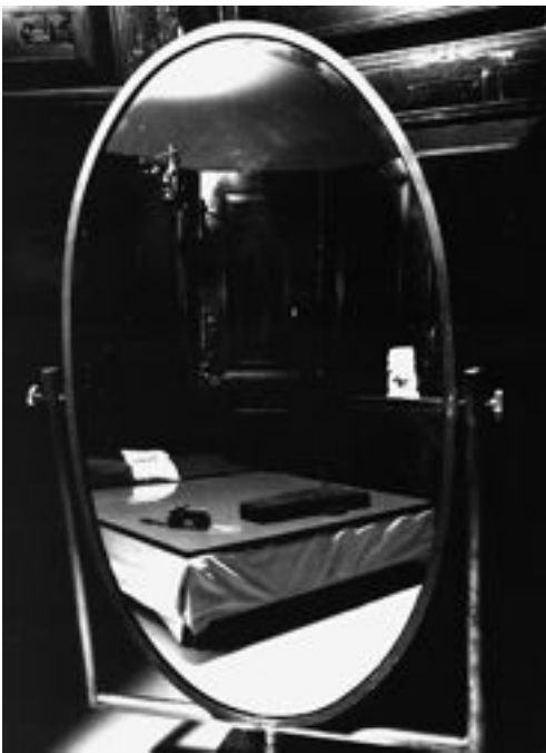
Fig. 1. Louise Bourgeois, Detalle del espejo de la instalación Cuarto Rojo (padres) , 1994.

La dialéctica binaria sujeto-imagen, en tanto que involucra la experiencia del presente ( I, Je ) y la memoria del pasado (así como la proyección del futuro: me, moi ), genera un sistema circular que fluye sin que haya ni principio ni final. De ahí que las imponentes torres que Bourgeois construyó para la apertura de la Tate Modern Gallery de Londres (2000, fig. 2) insisten en crear un sistema circular (de retroalimentación) que se evidencia no sólo en las estructuras de los propios espejos que conforman la obra, sino además en las plataformas que los sostienen y en las escaleras de caracol que nos conducen a ellas. Pero, y lo que es más importante, ésta es una estructura en espiral progresiva que está marcada por las relaciones de oscilación que implican cada una de las tres torres entre sí. En la primera torre (Fig. 2), las escaleras se muestran exentas, al igual que en la tercera (en la fig. 2 al fondo), mientras que la segunda presenta una estructura cerra-