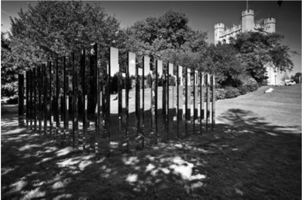
Fig. 5. Jeppe Hein, Sígueme , instalación permanente, campus Universidad de Bristol, 2009.

jos 21 . el lugar que propone Hein deja de ser antropocéntrico, pues expulsa la mirada egocéntrica del sujeto al no poder éste ordenar el espacio de acuerdo a su posición fija y única.