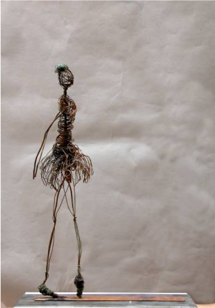
ATTITUDE 54 x 40 x 15 cm. Hierro y cobre