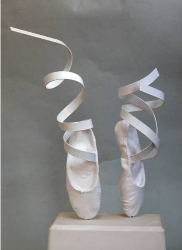
DESLIZANDO 60 x 40 x 20 cm. Escayola y aluminio anodizado