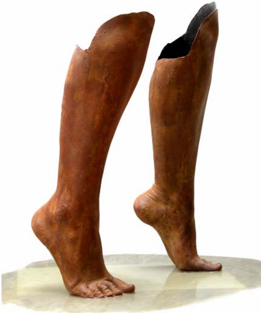
SIN TÍTULO 62 x 50 x 56 cm. Resina de poliéster