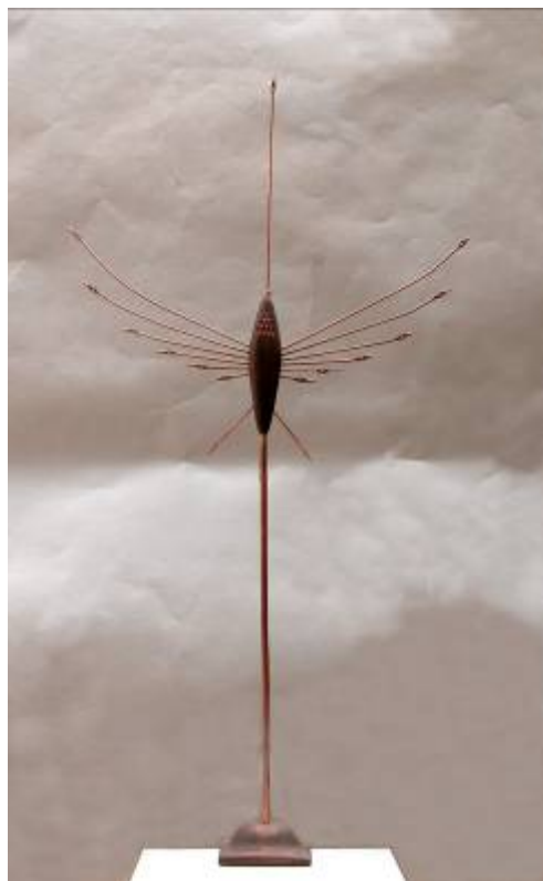
LA DANZA 76 x 41 x 7 cm. Metal y madera