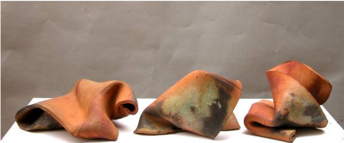
DANZA TRIBAL 75 x 30 x 15 cm. Arcilla roja