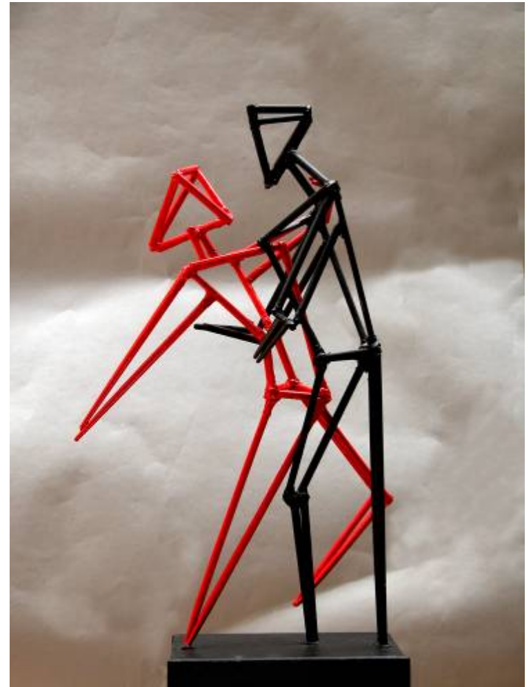
EL TANGO 50 x 26 x 17 cm. Madera y cartón