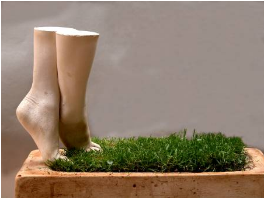
PIEL SOBRE CÉSPED 50 x 36 x 25 cm. Escayola