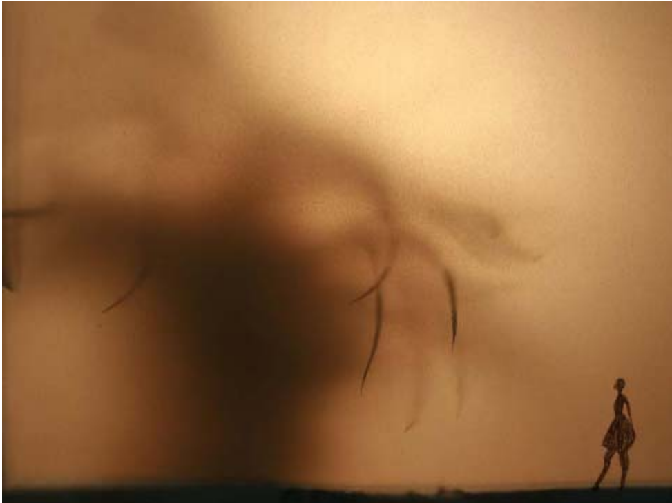
CAJA DE LUZ 35 x 35 x 35 cm. Madera, papel vegetal y motor