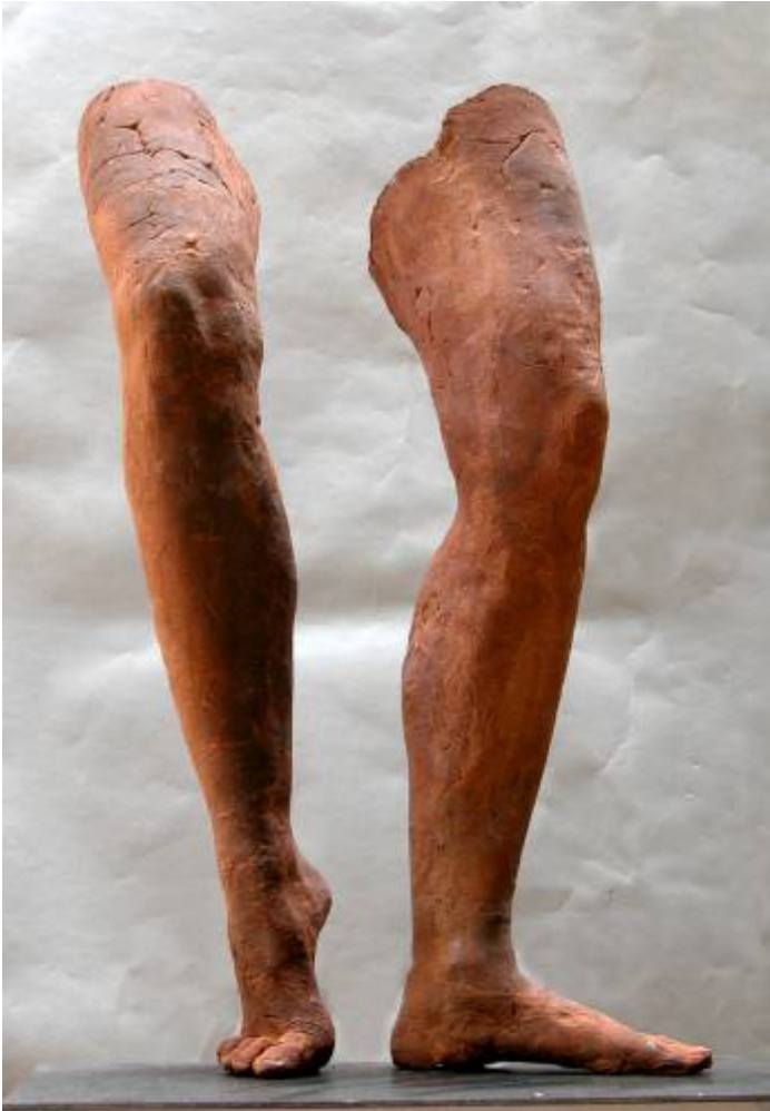
SIN TÍTULO 70 x 50 x 30 cm. Arcilla refractaria