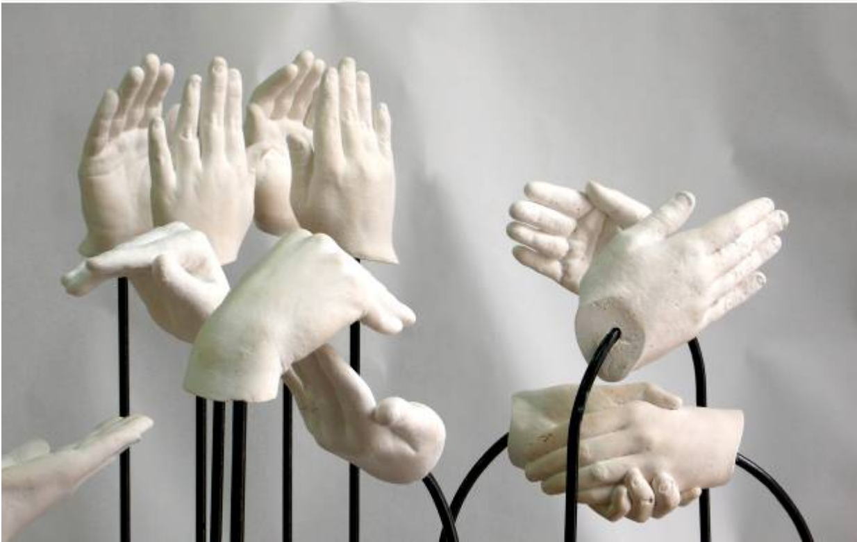
DANZA DE MANOS 120 x 81 x 81 cm. Escayola y hierro