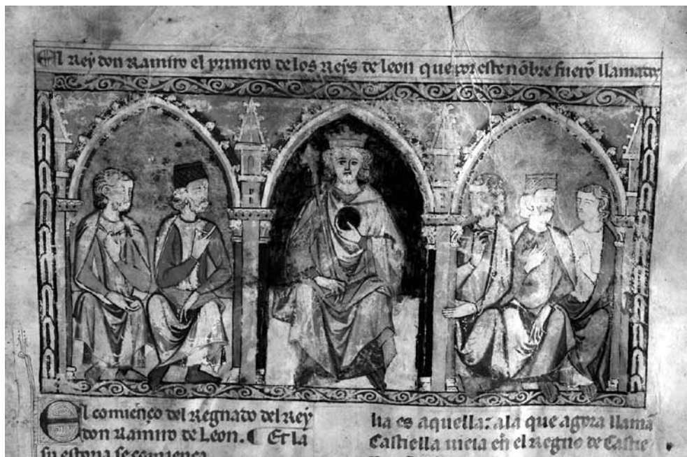
Fig. 5. Imagen de apertura con el retrato de un rey [Ramiro? Sancho IV?] y su corte, Ms. X-I-4, fol. 23r, RBME.

ennegrecido. La imagen está muy deteriorada, ha perdido parte del pigmento, aunque por sus trazos y la aplicación del color recuerda prototipos alfonsíes, especialmente la forma de hacer el cabello, las manos... No obstante esta imagen presenta modificaciones en su composición, apreciables a simple vista al ver como han sido modificados los rostros de algunos personajes (fig. 6), y probablemente fuese retocada posteriormente, tal y como delata el rostro del rey (fig. 7).