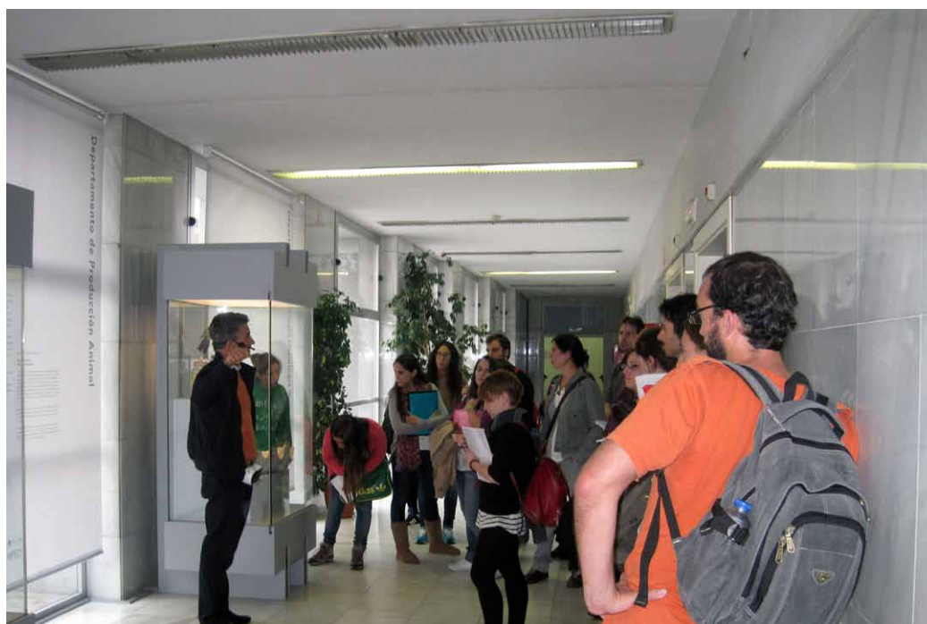
Fig.4 Visita guiada al almacén visible .

turales o de tercera edad, visitas institucionales de autoridades y responsables académicos y políticos. Estas visitas institucionales a veces no se someten a una programación previa, sino que surgen de modo inesperado a demanda de las autoridades académicas del centro, lo que obliga a una disponibilidad alta por parte de los responsables.