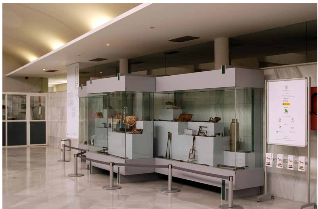
Fig.1 Vitrinas del Hall en el Hospital Clínico Veterinario.

La visita comienza con la exhibición de una muestra de los principales fondos y colecciones en el hall del hospital con un amplio acceso público ( Fig.1 ); el planteamiento es compaginar la difusión del patrimonio veterinario complutense con los ratos de espera del público que acude al hospital —más de 200 personas visitan cada día el hospital—, los objetos pre-