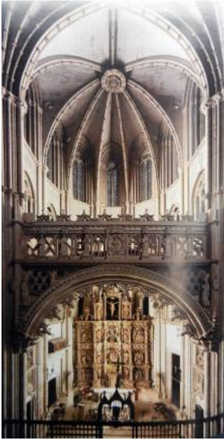
Fig. 15: Vista frontal de la Capilla del Sagrario. Catedral de Palencia. MARTÍNEZ, R. y PAYO, R. J. (ed.), La Catedral de Palencia: catorce siglos de historia y arte , Burgos, Promecal, 2011, p. 217.