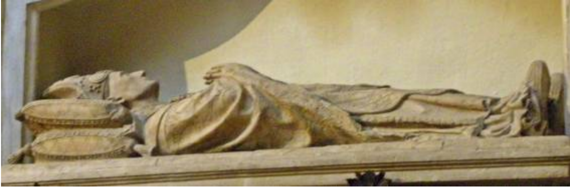
Fig. 23: Sepulcro de Sancho de Rojas. Nicho en muro occidental. Capilla de San Pedro. Catedral de Toledo.