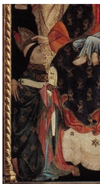
Fig. 18: Detalle de la tabla central de la Virgen. Retablo del arzobispo Sancho de Rojas. Museo Nacional del Prado.

http://www.museodelprado.es/coleccion/galeria-on-line/galeria-on-line/zoom/1/obra/retablo-del-arzobispo-don-sancho-de-rojas/oimg/0/ [Consultado: 11/09/2012]