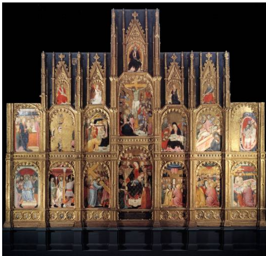
Fig. 17: Retablo del arzobispo Sancho de Rojas. Museo Nacional del Prado.

http://www.museodelprado.es/coleccion/galeria-on-line/galeria-on-line/zoom/1/obra/retablo-del-arzobispo-don-sancho-de-rojas/oimg/0/ [Consultado: 11/09/2012]