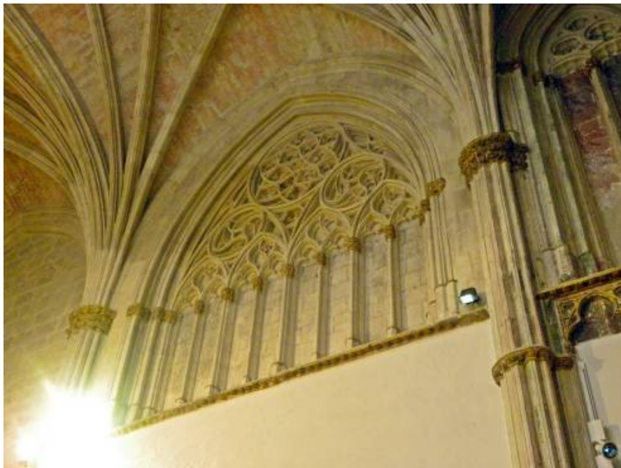
Fig. 20: Detalle tracería. Muro occidental. Capilla de San Pedro. Catedral de Toledo.