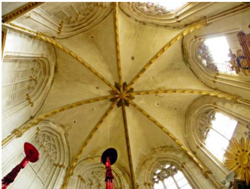
Fig. 1: Bóveda. Capilla de San Ildefonso. Catedral de Toledo.