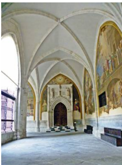
Fig. 9: Portada de la capilla de San Blas y panda del claustro. Catedral de Toledo.