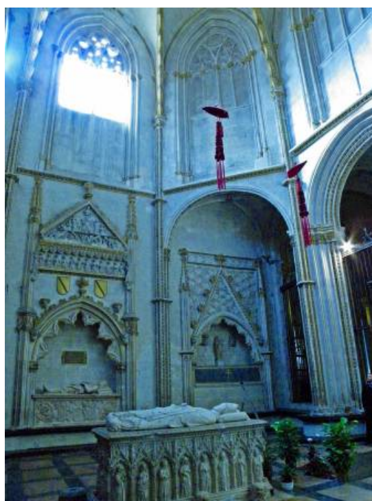
Fig. 2: Interior. Capilla de San Ildefonso. Catedral de Toledo.