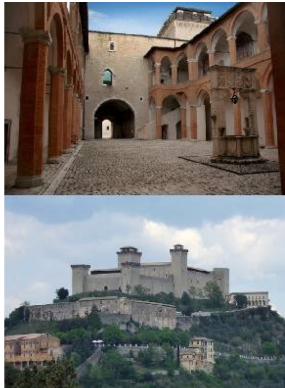
Fig. 4: Rocca de Spoleto. Patio de honor y vista exterior. http://www.assoroccaspoleto.it/ambienti.php [Consultado: 11/09/2012]