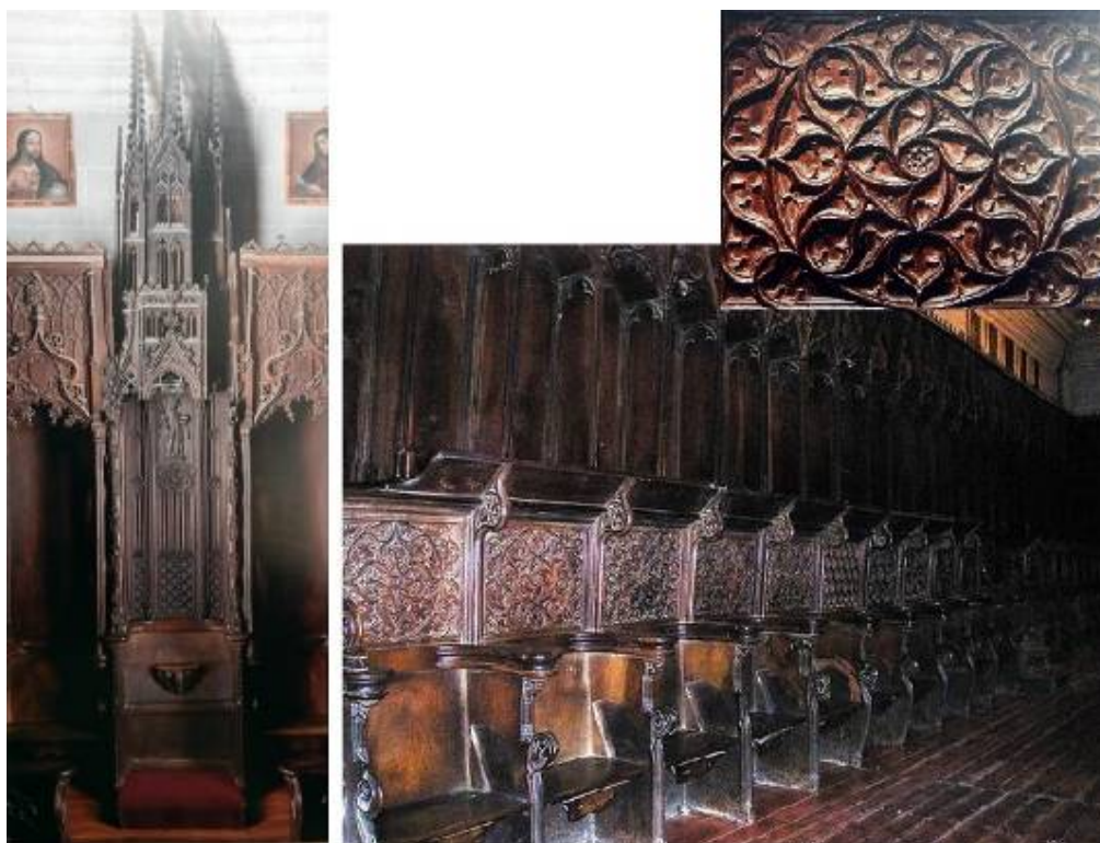
Fig. 14: Vista general y detalles de la sillería. Catedral de Palencia. MARTÍNEZ, R. y PAYO, R. J. (ed.), La Catedral de Palencia: catorce siglos de historia y arte , Burgos, Promecal, 2011, pp. 271-273.