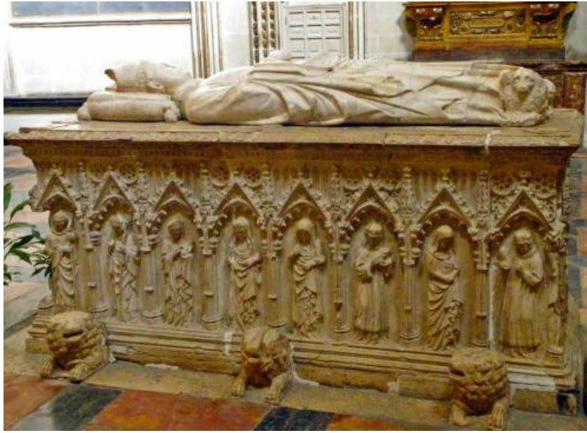
Fig. 3: Sepulcro de Gil de Albornoz. Capilla de San Ildefonso. Catedral de Toledo.