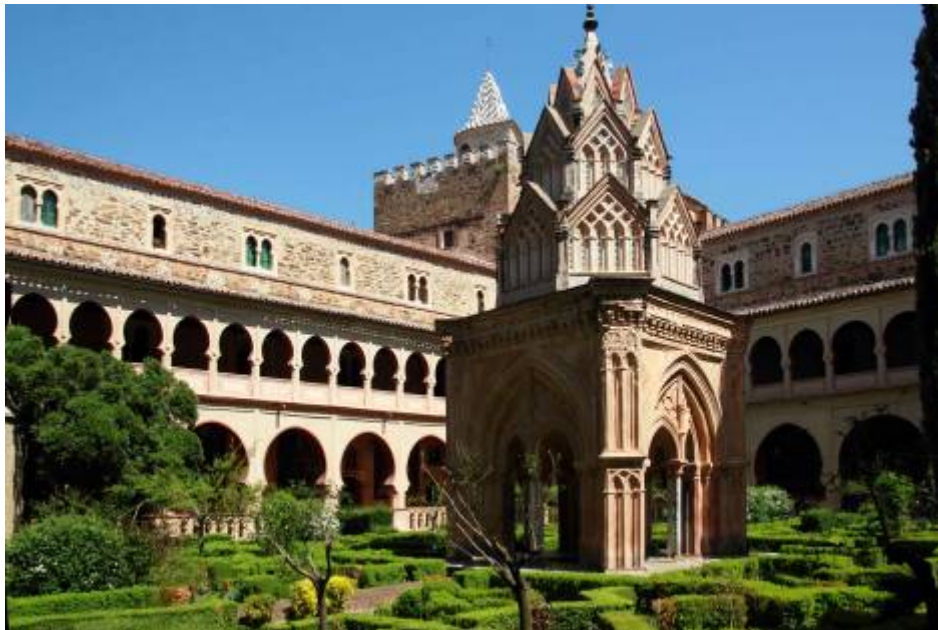
Fig. 8: Claustro. Monasterio de Guadalupe. Fotografía de Diana Olivares.

http://www.turismocastillalamancha.com/lugares/toledo/el-puente-del-arzobispo/fotos/ [Consultado: 11/09/2012]