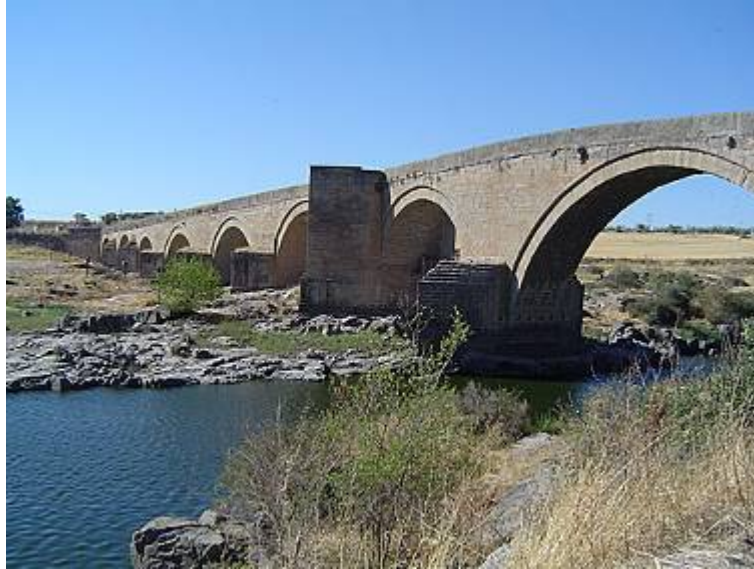
Fig. 7: Puente del Arzobispo.

http://www.turismocastillalamancha.com/lugares/toledo/el-puente-del-arzobispo/fotos/ [Consultado: 11/09/2012]