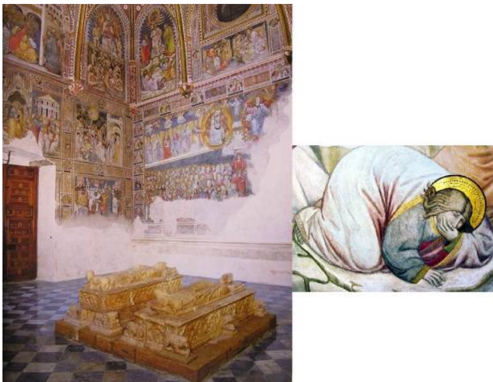
Fig. 12: Interior y detalle de las pinturas murales. Capilla de San Blas. Catedral de Toledo. VVAA, La capilla de San Blas de la Catedral de Toledo , Madrid, Iberdrola, 2005, p. 31.