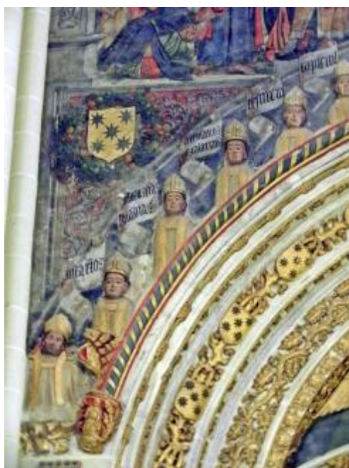
Fig. 22: Detalle de la portada. Enjuta izquierda. Capilla de San Pedro. Catedral de Toledo.