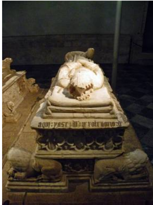
Fig. 11: Sepulcro de Pedro Tenorio. Capilla de San Blas. Catedral de Toledo.