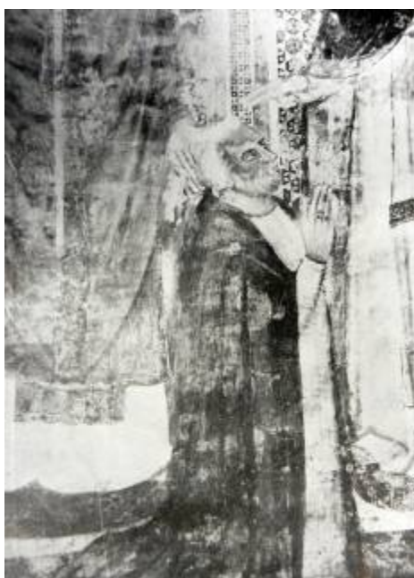
Fig. 5: Retrato de Gil de Albornoz. Pintura mural en la capilla de Santa Catalina. Iglesia inferior de San Francisco de Asís. BENEYTO, Juan, El cardenal Albornoz: canciller de Castilla y caudillo de Italia , Madrid, Espasa-Calpe, 1950.