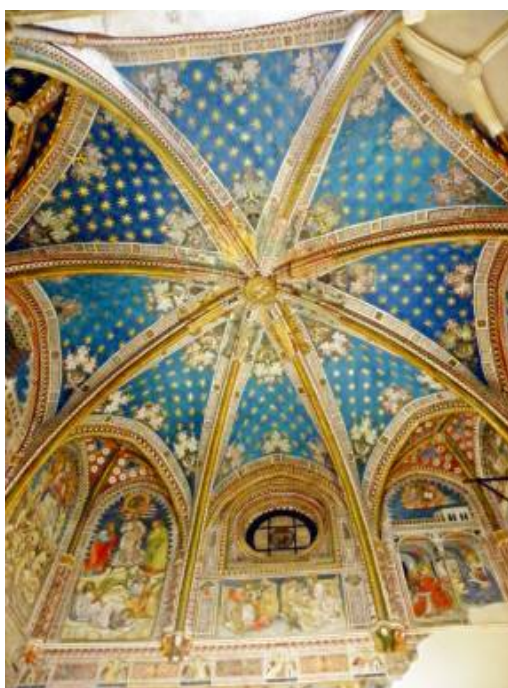
Fig. 10: Bóveda. Capilla de San Blas. Catedral de Toledo.