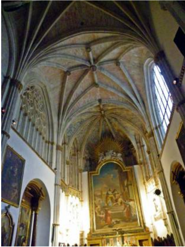
Fig. 19: Interior. Capilla de San Pedro. Catedral de Toledo.