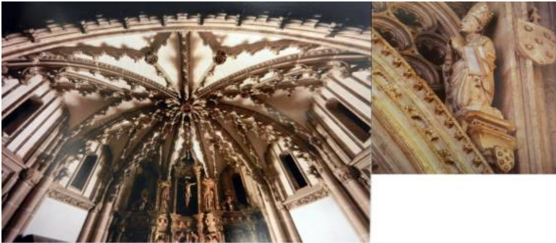
Fig. 16: Detalle de la bóveda y enjuta del lado sur de la entrada. Capilla del Sagrario. Catedral de Palencia. MARTÍNEZ, R. y PAYO, R. J. (ed.), La Catedral de Palencia: catorce siglos de historia y arte , Burgos, Promecal, 2011, p. 216.