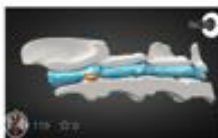
Hernia discal C2-C3