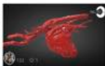
Patent Ductus Arteriosus (CAP)