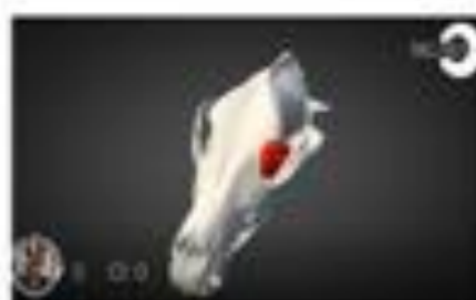
Maca craneo LIONPO