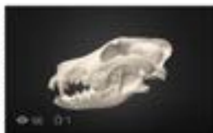
Dog Skull HD (high poly)