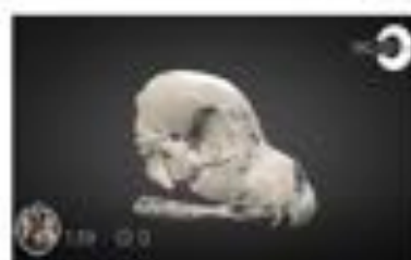
Cranial fracture (Preoperative)