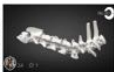
Fractura faceta articular C6-C7