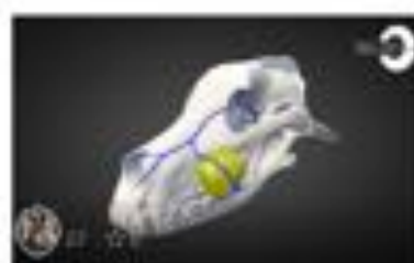
Masa Maxilar (LOW POLY)