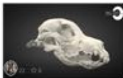
Craneal fracture (Postoperative)