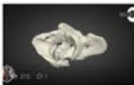
Fractura cervical - Cervical fract...