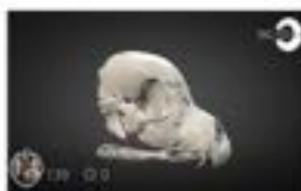
Cranial fracture (Preoperative)