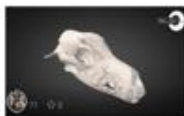
Fractura craneal (Galgo) / Crane...