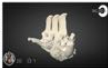
Discoespondilitis - Caballo