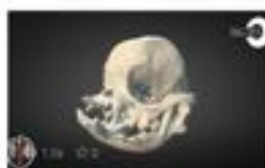
Brachycephalic Dog (SKULL)