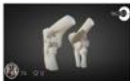
Displasia de codo (IPCM)- Elbow...