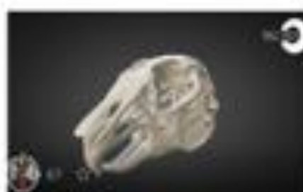
Cráneo conejo / Rabbit skull