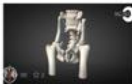
Fractura de pelvis en gato