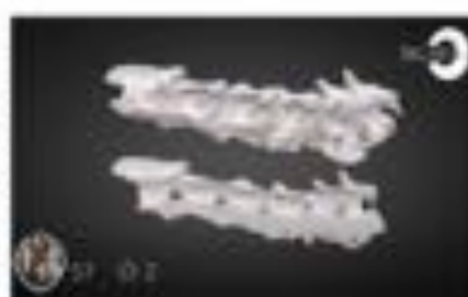
Fractura & Subluxación vertebral