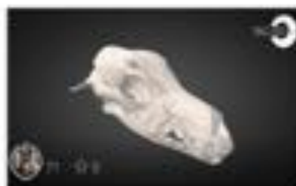
Fractura craneal (Gaija) / Crane...