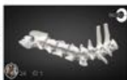
Fractura faceta articular C6-C7