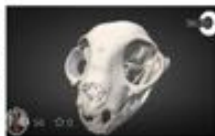
Cranio de gato (HIGH POLY)