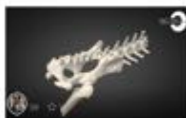
Fractura de Sacro / Sacral Fractu...