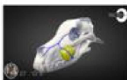
Masa Maxilar (LOW POLY)