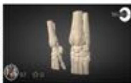
Ex Hueso accesario del carpo EA...