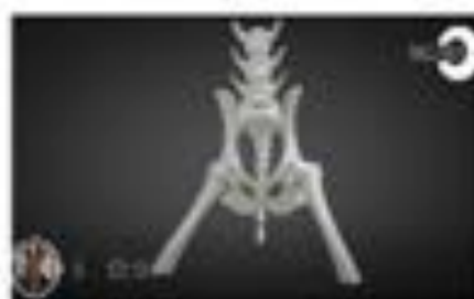
Dysplasia de cadera en Perro