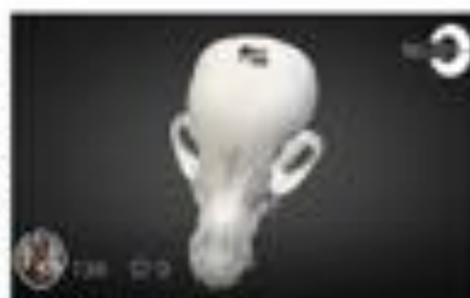
Dysplasia occipital - Occipital dy...