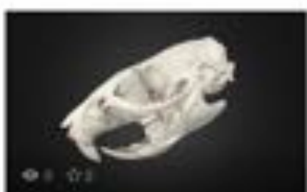
Rat Skull High Poly