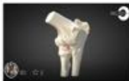
Droplasia de codo (FFCM) - Elbow.