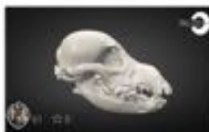
Skull of a dog (Schriauzer)