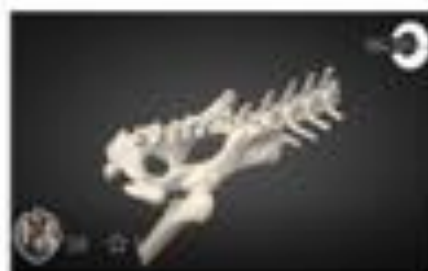
Fractura de Sacro / Sacral Fractu...