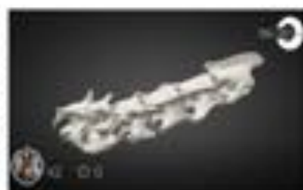
Fractura & Subluxación verteb...