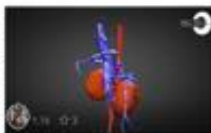
Shunt portosistemico - portosyst...