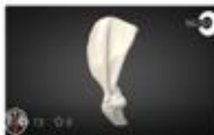
Fractura de escápula