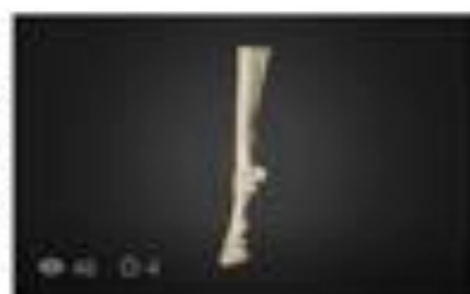
Hind limb of a horse