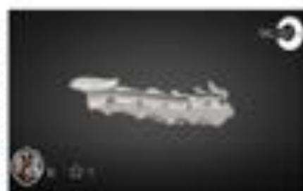
Fractura & subluxación cervic...