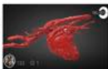
Patent Ductus Arteriosus (PDA)