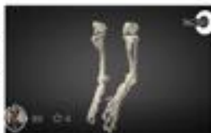
PES VARUS (Teckel)