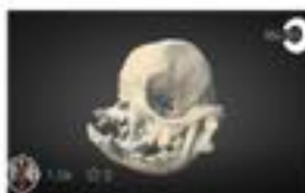
Brachycephalic Dog (SKULL)