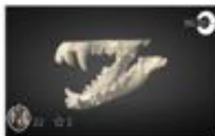
Dental Chart - DOG