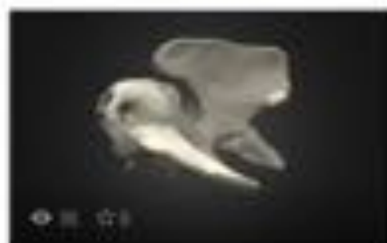
Atlas y axis normales