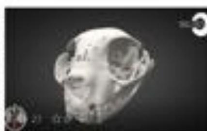
Cráneo de gato - Cat Skull