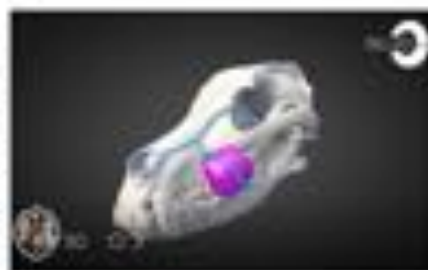
Masa maxilar (High Poly)