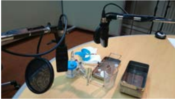
Imagen 10. Grabación de instrumental médico para simular la preparación de una inyección y el posterior pinchazo en el Teatro 2 de La Casa de la Radio (RNE).

Audio 14. Sherlock Holmes. El signo de los cuatro. Escena droga [Fuente RNE].