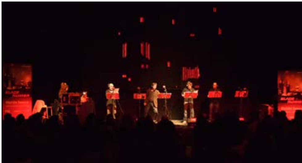
Imagen 21. Escenario y luces para Blade Runner .

Las obras se retransmiten en directo a través de Radio 3 y en streaming de video a través de www.rtve.es . Un grupo de alumnos de Realización del Instituto de RTVE es el encargado de esta tarea. Unas horas antes de la emisión, se hace un ensayo general, que además servirá para arreglar el podcast , en el caso de que haya habido durante la emisión algún fallo importante y destacable —se sustituiría ese fragmento por el del ensayo general—, ya que el podcast quedará alojado en Internet para su descarga libre. También se hace una grabación de la palabra limpia, sin el resto del montaje, para una postproducción en sonido multicanal 5.1.