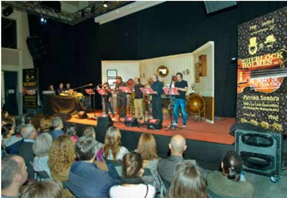
Imagen 16. Sherlock Holmes . Escenario de La Casa Encendida.

Para la emisión en directo desde La Casa Encendida, se monta el mismo equipo técnico con el que se ha ensayado, y en la misma posición.