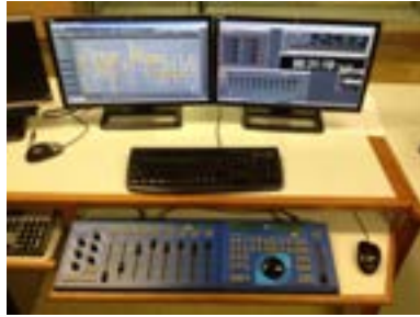
Imagen 7. Editor multipista Sadie con el que se montan las ficciones en RNE.