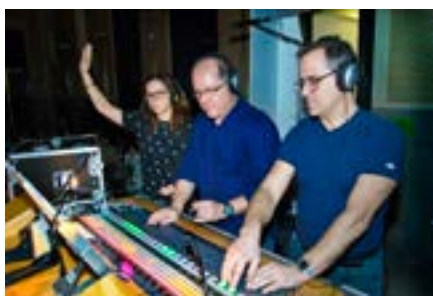
Imagen 22. Equipo de realización en La Casa Encendida.

Las obras se retransmiten en directo a través de Radio 3 y en streaming de video a través de www.rtve.es . Un grupo de alumnos de Realización del Instituto de RTVE es el encargado de esta tarea. Unas horas antes de la emisión, se hace un ensayo general, que además servirá para arreglar el podcast , en el caso de que haya habido durante la emisión algún fallo importante y destacable —se sustituiría ese fragmento por el del ensayo general—, ya que el podcast quedará alojado en Internet para su descarga libre. También se hace una grabación de la palabra limpia, sin el resto del montaje, para una postproducción en sonido multicanal 5.1.