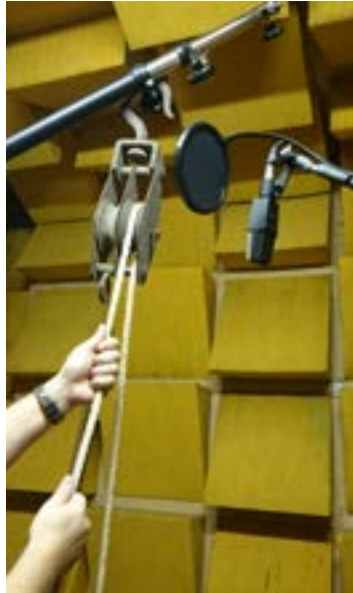
Imagen 11. Grabación de una polea en el Teatro 2 de La Casa de la Radio (RNE).

Audio 16. Sherlock Holmes. El signo de los cuatro. Ruido retocado del bolso y con polea [Fuente RNE].