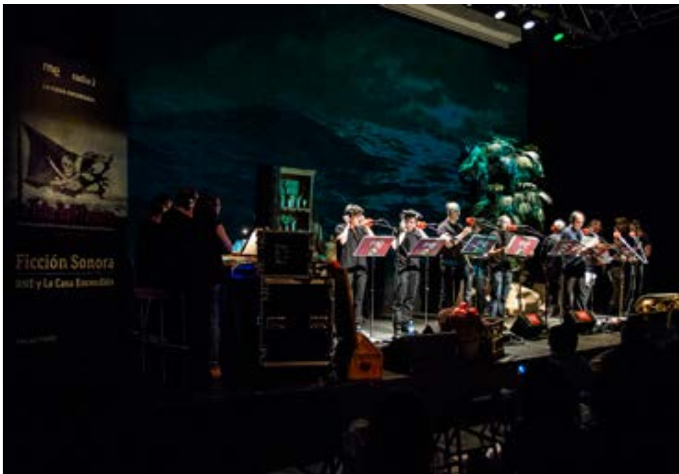
Imagen 1. El equipo de Ficción Sonora RNE durante la representación de La isla del tesoro (junio, 2014) en el escenario de La Casa Encendida.

Ficción sonora RNE rescata la tradición de la emisión en directo y cara al público de los primeros radioteatros. Realiza espacios ficcionales de larga duración, de alta densidad sonora y de emisión esporádica. Los guiones son fieles a la esencia de la obra adaptada, aunque no a su estructura ni al número de personajes. Suelen participar entre doce y veinte actores, si bien los personajes no están todos a la vez en escena.