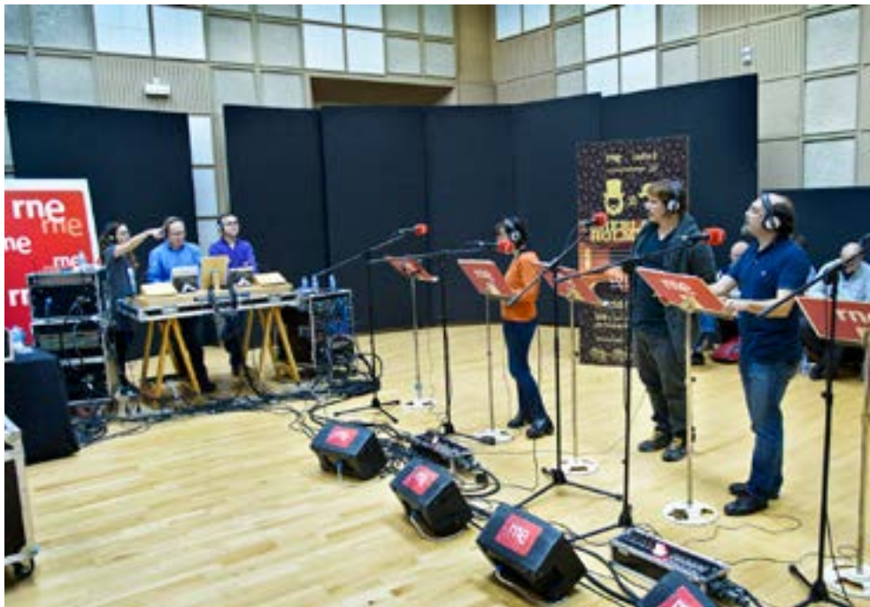
Imagen 14. Sherlock Holmes . Ensayo.

En Ficción sonora RNE realizamos tres ensayos antes del día de la emisión en directo y cara al público. A ellos acuden técnicos, realizador, director, guionista y el equipo artístico completo. Se instala el mismo material técnico que después se llevará al directo, ubicado de la misma forma que lo haremos en el escenario.