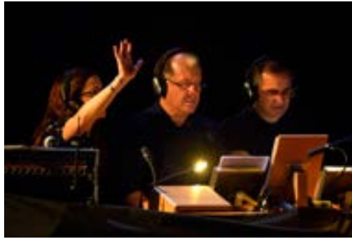
Imagen 15. Sherlock Holmes . Realización.

lateral de la línea de micrófonos y orientada hacia ellos se coloca la mesa de mezclas y el resto del equipo, de manera que los actores miran hacia el público mientras que técnicos y realizador miran hacia los actores. Como los actores deberán atender constantemente a las indicaciones del realizador, se pasarán toda la obra mirando hacia un lateral.