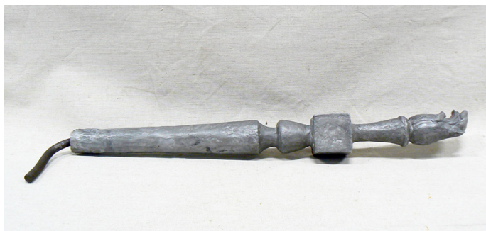
Figura 2. Imagen de la antorcha arrancada.

Recientemente, la antorcha ha sido robada de nuevo y, al contrario de lo sucedido en otras ocasiones, esta vez no ha reaparecido. El planteamiento de restauración de la obra mediante la reposición de esta parte faltante ha sido desarrollado recientemente en dos proyectos PIMCD 12 de la Universidad Complutense de Madrid y será descrito en los epígrafes subsiguientes.