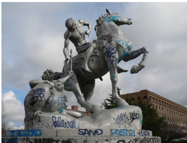
Figura 1. Imagen correspondientes al conjunto escultórico Los Portadores de la Antorcha en el año 2011, poco antes de que desapareciera la antorcha ese mismo año. Pueden apreciarse los grafitis que entonces la recubrían. ©Montaña Galán Caballero.

Una de las obras pertenecientes a la Universidad Complutense de Madrid y que recientemente ha pasado por la situación mencionada es Los Portadores de la Antorcha , ubicada en la Ciudad Universitaria. A lo largo de su historia, esta obra ha sido objeto de múltiples actos vandálicos. Ya en el año 2011 la antorcha, elemento primordial, fue arrancada de la mano de la figura, pero apareció poco después. Se fijó entonces de nuevo la pieza a la mano de la figura mediante el empleo de una resina epoxídica coloreada. Esta actuación fue llevada a cabo por un equipo de profesores de la Facultad de Bellas Artes de la Universidad Complutense de Madrid.