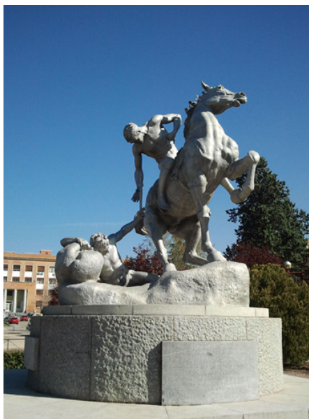
Figura 6. Aspecto final de la escultura.

Lo más adecuado para este proyecto hubiera sido terminarlo con la noticia de la colocación de la antorcha en su lugar; sin embargo, siete días después de haber fijado la antorcha a la escultura, ha sido arrancada y destrozada. Se prevé la realización de un nuevo vaciado en resina y se planteará si se coloca en su lugar o si, sencillamente, se reservará su reubicación para momentos de especial relevancia para la historia de la Universidad, con lo que podría plantearse que la antorcha fuera desmontable. Otra opción para este elemento podría ser realizar el vaciado en aluminio, ya que