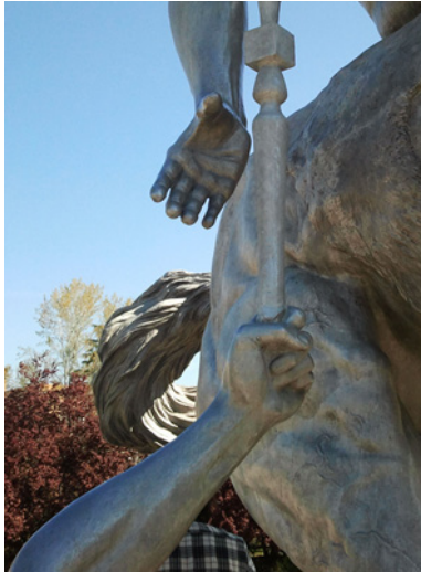
Figura 5. Antorcha de resina ubicada en la escultura (detalle).