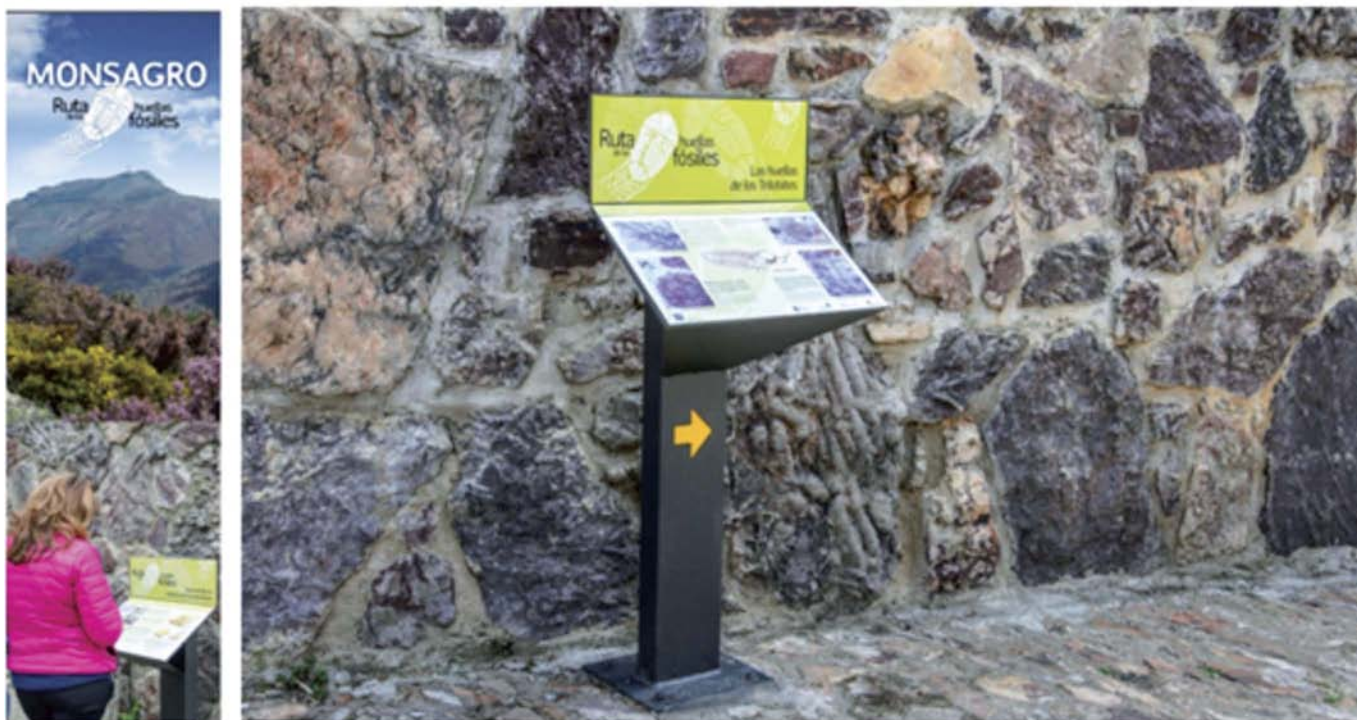
Fig. 2.- Aspecto de dos de los paneles instalados, mostrando en su parte superior el logotipo de la georuta. Ver figura en color en la web.

Se han realizado paneles interpretativos (Fig. 2) que ilustran de una forma sencilla el itinerario de la georuta. Cada panel desarrolla un tema específico con una composición de contenidos y recursos digitales diferentes. El primero se titula "La ruta de las huellas fósiles: un paseo por los mares antiguos", y presenta un mapa paleogeográfico del Ordovícico con la distribución mundial de los continentes y la ubicación de Monsagro. Las plataformas marinas someras de la futura Península Ibérica se situaban entonces cercanas al polo sur terrestre, en un ambiente de aguas gélidas del otro hemisferio. Para entender los tiempos geológicos se añade una tabla cronoestratigráfica sencilla, con algunos símbolos (calaveras) que representan las grandes extinciones masivas ocurridas a lo largo de los 3800 millones de años de historia de la Vida.