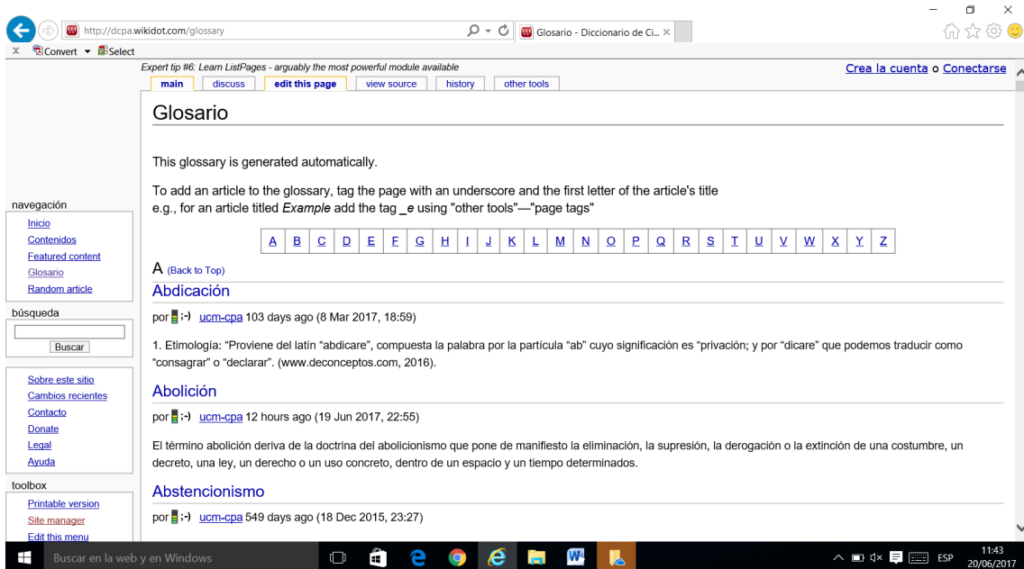
Figura 2: Glosario