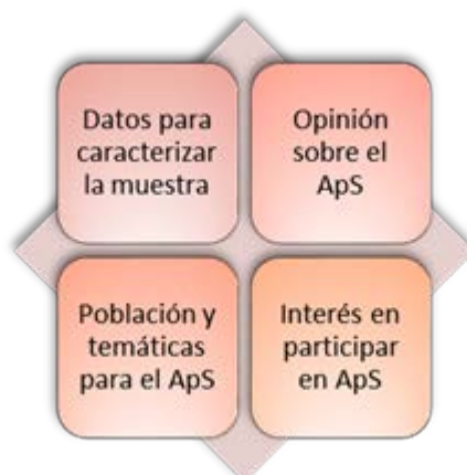
Gráfico nº 1. Preguntas de los cuestionarios.

El cuestionario se conformó con 7 preguntas, distribuidas en cuatro aspectos, como se indica en el gráfico nº 1. La aplicación de los cuestionarios fue en papel y a través de un enlace en el Google Drive . Todos participaron voluntariamente después de haber sido informados de los objetivos del Proyecto.