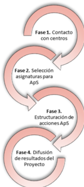
Gráfico nº 2. Fases del Proyecto ApS.

Fase 4. Se están difundiendo los resultados del Proyecto y concordando con un instituto de educación secundaria una propuesta de ApS para ser desarrollada el curso próximo curso.