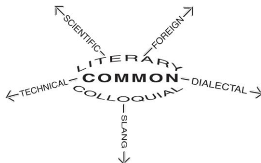
Figura 1. Taxonomía de registros lingüísticos de Murray.

Las lenguas se hablan dentro de un registro y contexto específicos. Al hablar de registro, nos referimos a “a particular choice of diction or vocabulary regarded as appropriate for a certain topic or social situation” (Hughes, 2006: 386). La lengua inglesa se caracteriza por una serie de registros marcados, es decir, un registro elevado (tales como estructuras formales, profesionales y literarias), y uno bajo (lenguaje coloquial, el utilizado en situaciones cómicas, etc.). Murray et al. (1884, en Hughes, 2006: 387) muestran los diferentes tipos de registros desde el lenguaje formal al informal, tal y como se puede ver en la figura 1.