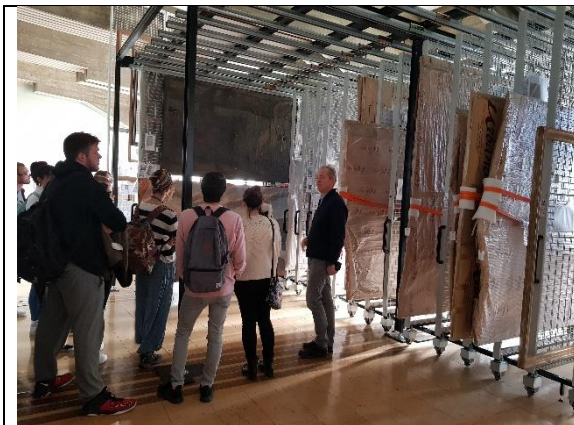
Visita al Instituto de Patrimonio Cultural de España. Area de Conservación Preventiva