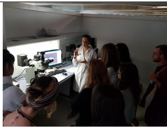
Visita al Instituto de Patrimonio Cultural de España. Area de Estudios Químicos