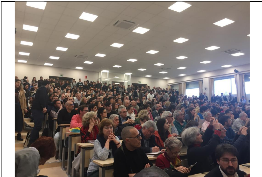
Conferencia magistral de Sir John Elliot: Escocia y Cataluña. Naciones sin Estado, el 13 de marzo de 2019, en el Salón de actos de la Facultad de Geografía e Historia