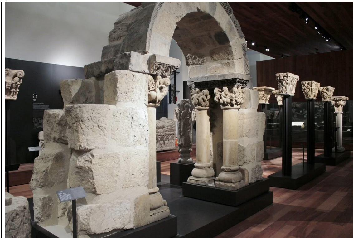
Visita al Museo Arqueológico Nacional, dentro de la asignatura Pintura y Sociedad en la Edad Media.

Otros: área de Estudios Químicos Instituto de Patrimonio Cultural de España