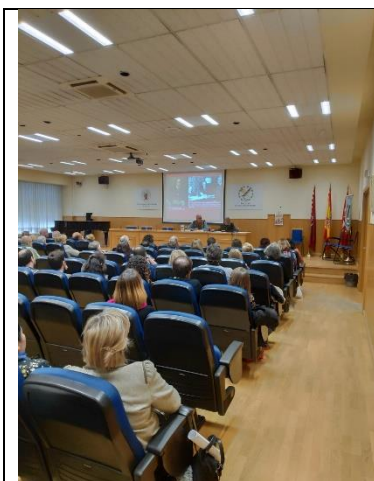
Seminario de investigación: “Elías Tormo y los retos de la Historia del Arte”, celebrado el 25 de abril de 2019 en el salón de actos de la Facultad de Geografía e Historia