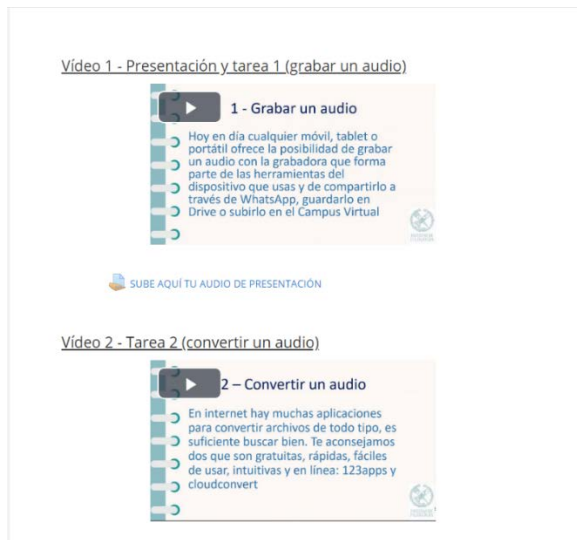
Figura 2. Vídeo-tutoriales en el Curso 0

Entre las cuestiones de formato, destaca el que se descartó colgar presentaciones de PowerPoint tal cual, favoreciéndose la realización de vídeo-tutoriales en los que se grababa las presentaciones mientras se explicaban. En la Imagen 2 se muestra una captura de pantalla de uno de estos vídeo tutoriales, accesibles desde el recurso de etiquetas de Moodle , por su mayor elegancia, como se ha explicado más arriba.