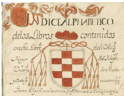
BH MSS 308

El Documento de Trabajo se completa con los índices de las instituciones y las personas mencionadas en los manuscritos bibliográficos, entre las que se encuentran los bibliotecarios que participaron en su redacción.