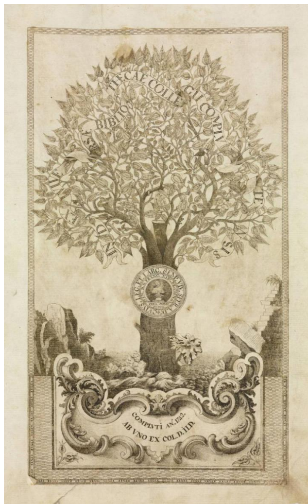
BH MSS 313