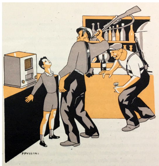
Imagen 1. Ilustración del cuento Le campane di Malaga . 38

La historia, una vez muerta la madre, se focaliza en otro personaje femenino: la abuela. Aquellos hombres que frecuentaban la tienda de Dreuccio aparecen nuevamente en la historia y ponen en peligro la vida de la nonna , acompañándolo de imágenes que contribuían a profundizar en el miedo a los milicianos republicanos. Como se puede observar en la ilustración (imagen 1), el joven italiano se interpone para defender a su abuela, lo cual le pone en peligro. En la imagen se puede observar cómo eran hombres de gran constitución. Uno de ellos bebía y animaba al otro, que, colocado frente al joven italiano, se disponía a propinarle un golpe con una escopeta. Esta ilustración resulta destacable por la crueldad, victimización, y sobre todo, por la desproporción física de los varones respecto al niño.