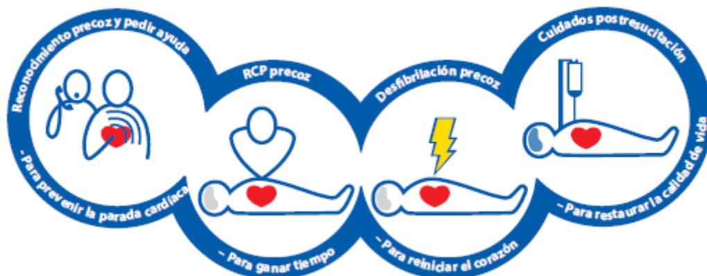
Gráfica 2: Cadena de supervivencia en una PCEH según la AHA.