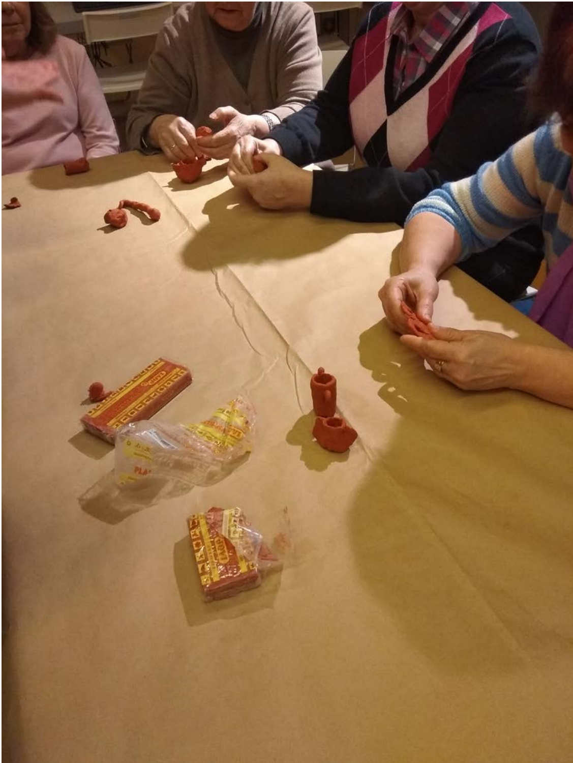
Actividades de consolidación y aplicación de lo aprendido durante las visitas en el taller del Museo Arqueológico Nacional. 17 de diciembre de 2019.