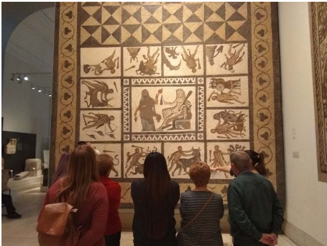
Visita guiada al Museo Arqueológico Nacional. 17 de diciembre de 2019.