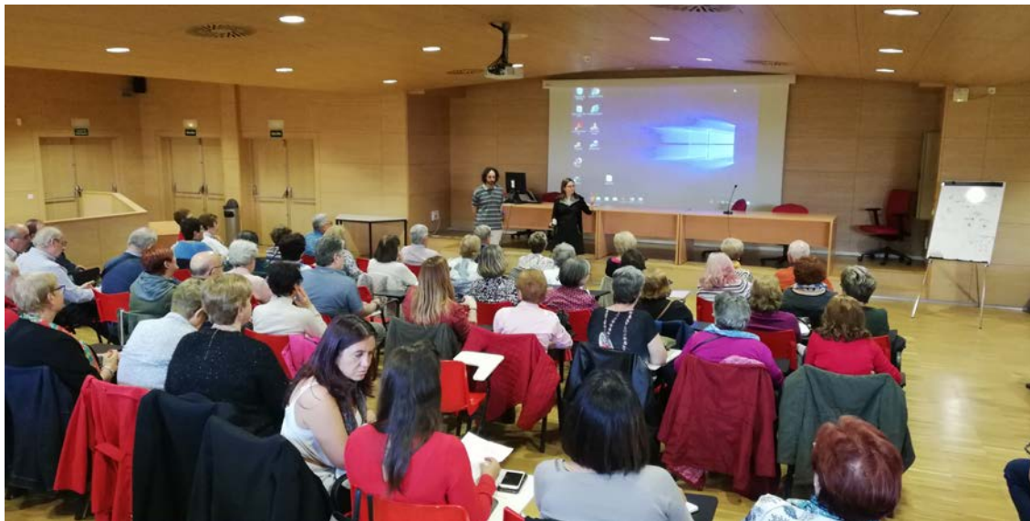
Seminario de trabajo cooperativo coordinado UCM-IES Miguel Catalán-Asociaciones de Mayores de Coslada y San Fernando-Asociación AFA Corredor en la Universidad Complutense de Madrid. 29 de octubre de 2019.