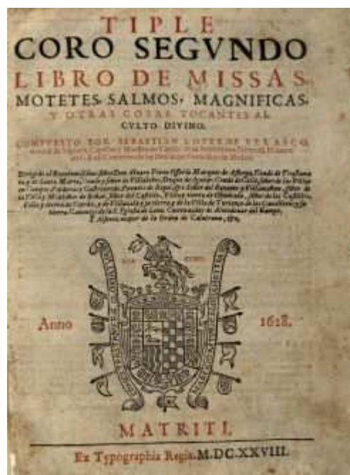
BH FG 166

La biografía de Melchor López tiene una gran similitud con otros compositores destacados del siglo XVII y de la primera mitad del XVIII. Empiezan su aprendizaje al lado de un maestro de capilla como niños de coro, más tarde ingresan en la carrera sacerdotal y, tras una dura oposición obtienen un puesto en el cabildo que gobierna alguna catedral o iglesia importante. Si tienen éxito son contratados por las catedrales importantes y viajan por toda España. Este es el caso de Sebastián López de Velasco que tras ejercer en su ciudad natal, Segovia, como maestro de capilla de la Catedral, en 1619 es nombrado maestro y capellán de las Descalzas Reales de Madrid, cargo que ocupará hasta 1636, cuando se traslada a Granada.