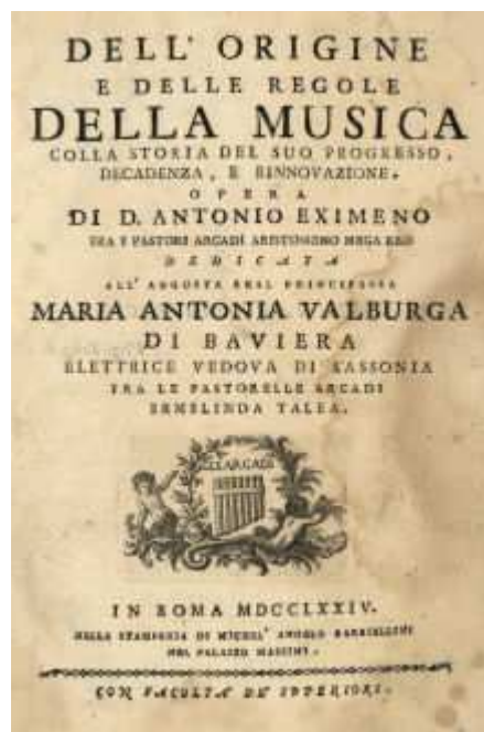
BH FG 167

Esta obra suscitó una gran polémica entre sus contemporáneos en el momento de su publicación debido a la crítica que Antonio Eximeno hace de la enseñanza musical del momento, del academicismo de la teoría tradicional de la música europea, así como de la utilización de las formas musicales anteriores. Otra de las novedades aportadas por Eximeno, es la idea de que la música religiosa adopte los criterios estilísticos de su época, es decir adopte los cambios que se están produciendo en la música profana. La edición española de esta obra Del origen y reglas de la Música... Madrid, imprenta Real, 1796 [BH FG 156 -158], fue