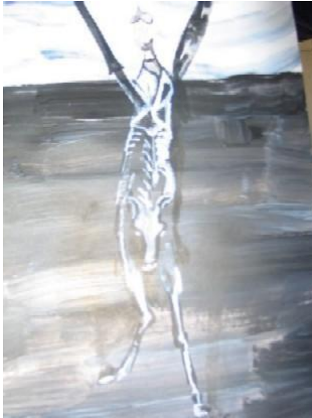
Cap. II. Primera salida que de su tierra hizo el ingenioso...