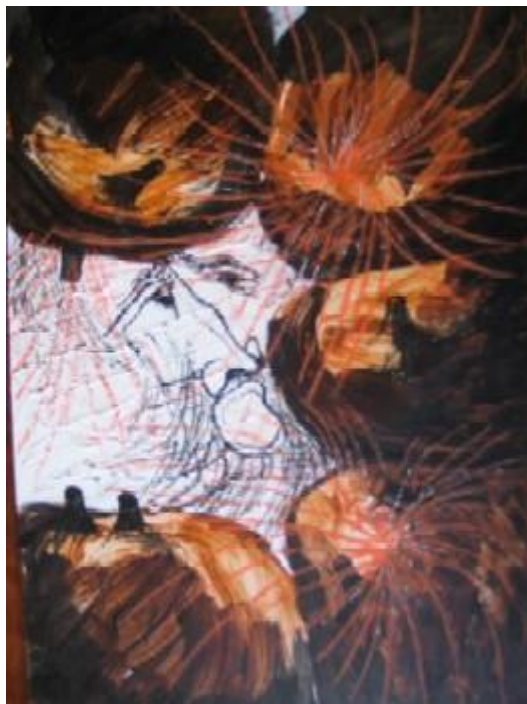
Cap. XXXV. Descomunal batalla... con unos cueros de vino