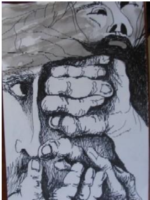
Cap. XVI. La asturiana Maritornes y Sancho apaleado