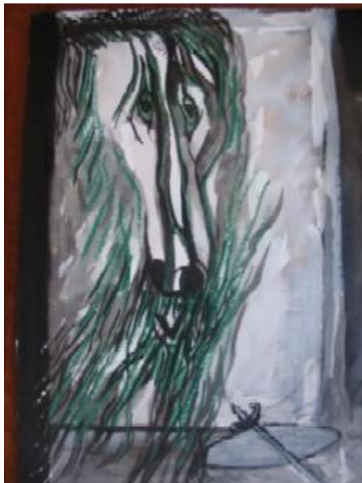
Cap. XIX. El Caballero de la Triste Figura