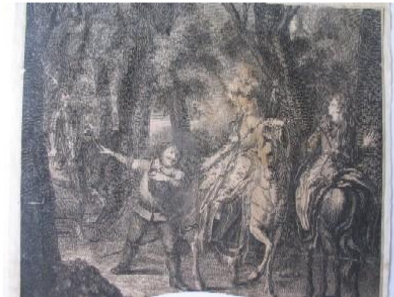
Picard Le Romain. Las bellas cazadoras (Pintura de Ch. A. Coypel.1746)