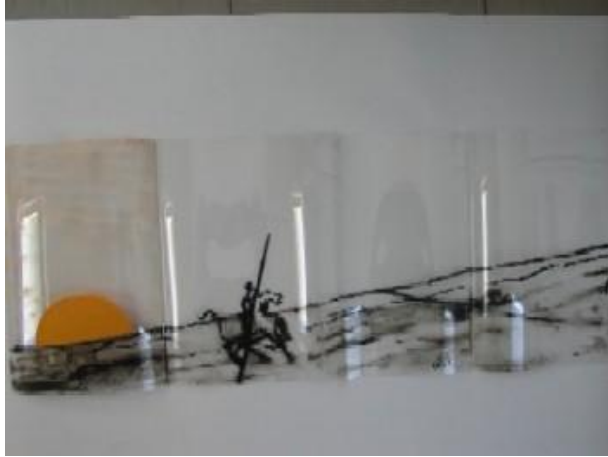
Don Quijote al amanecer