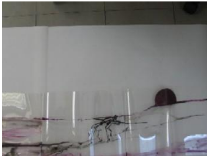
Don Quijote al anochecer