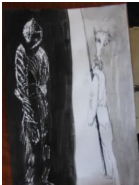
Cap. III. De la graciosa manera que tuvo Don Quijote de armarse caballero Quijote"