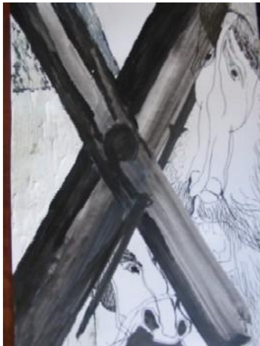
Cap. VIII. Del buen suceso... en la... aventura de los molinos...