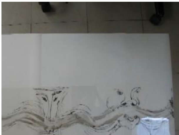
Ritmos femeninos con mirones