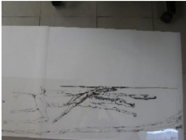
Don Quijote y Rocinante galopando