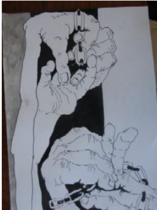
Cap. XXII. Cadena de galeotes, gente forzada del Rey que va a galeras Quijote"