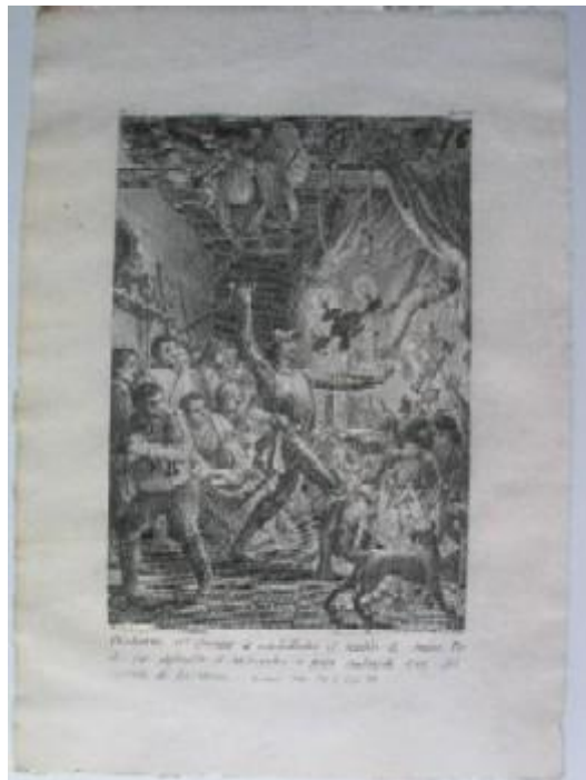
Francisco Muntaner. Retablo de Maese Pedro (Dibujo de A. Carnicero. 1977)