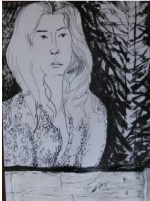
Cap. XIII. Historia de la bella pastora Marcela y Crisóstomo