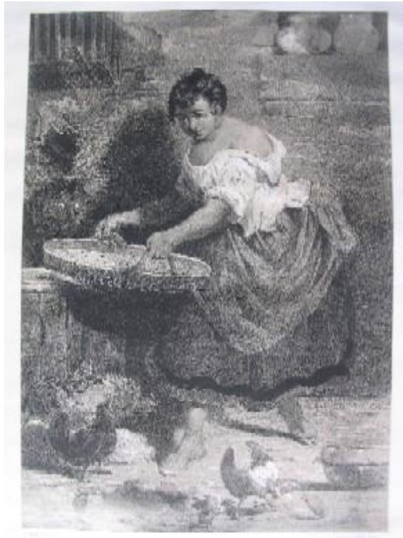
Célestin Nanteuil. Dulcinea del Toboso. 1855