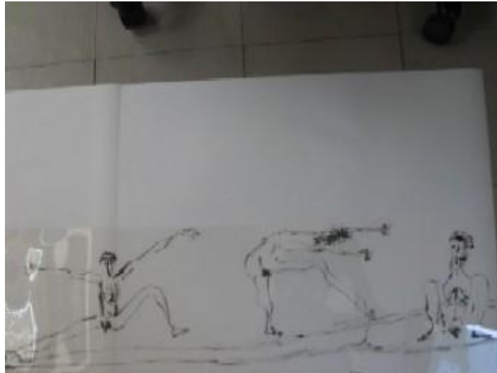
En cueros Don Quijote y los galeotes