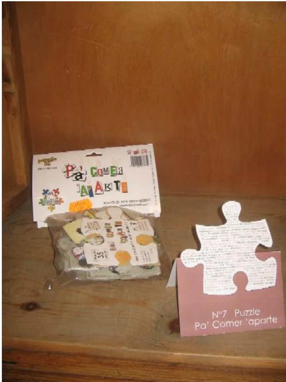
Pa comer aparte. Imágenes