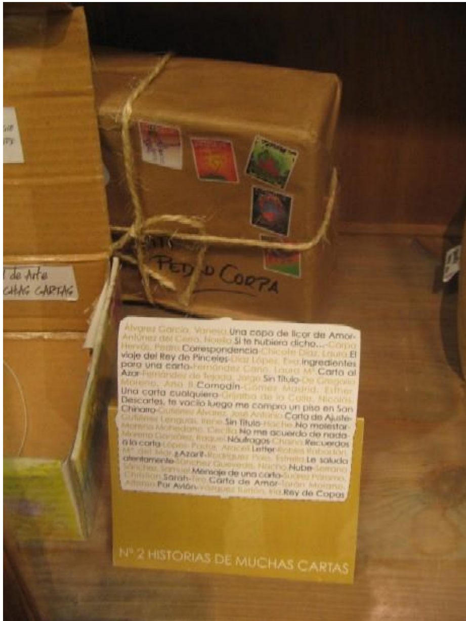
Pa comer aparte. Imágenes