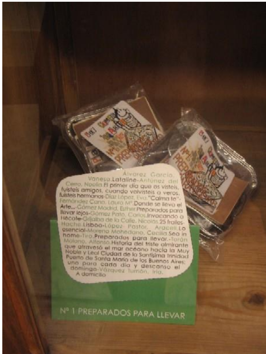
Pa comer aparte. Imágenes