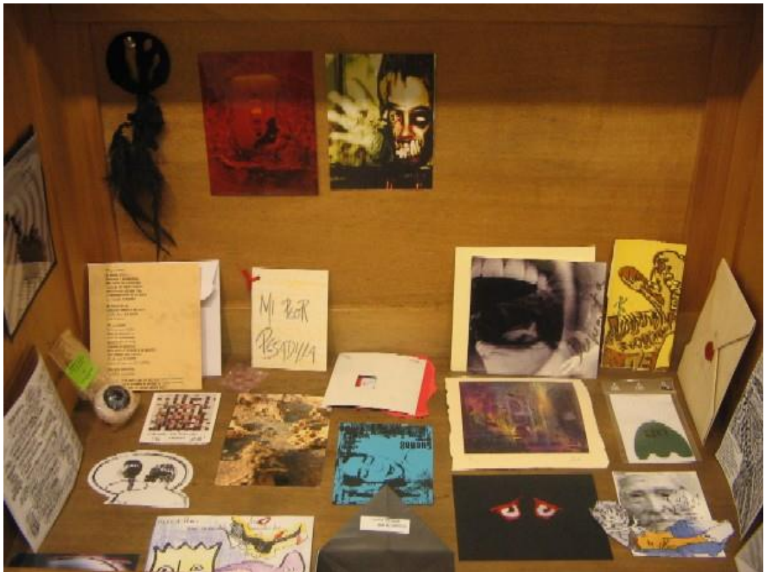
Pa comer aparte. Imágenes