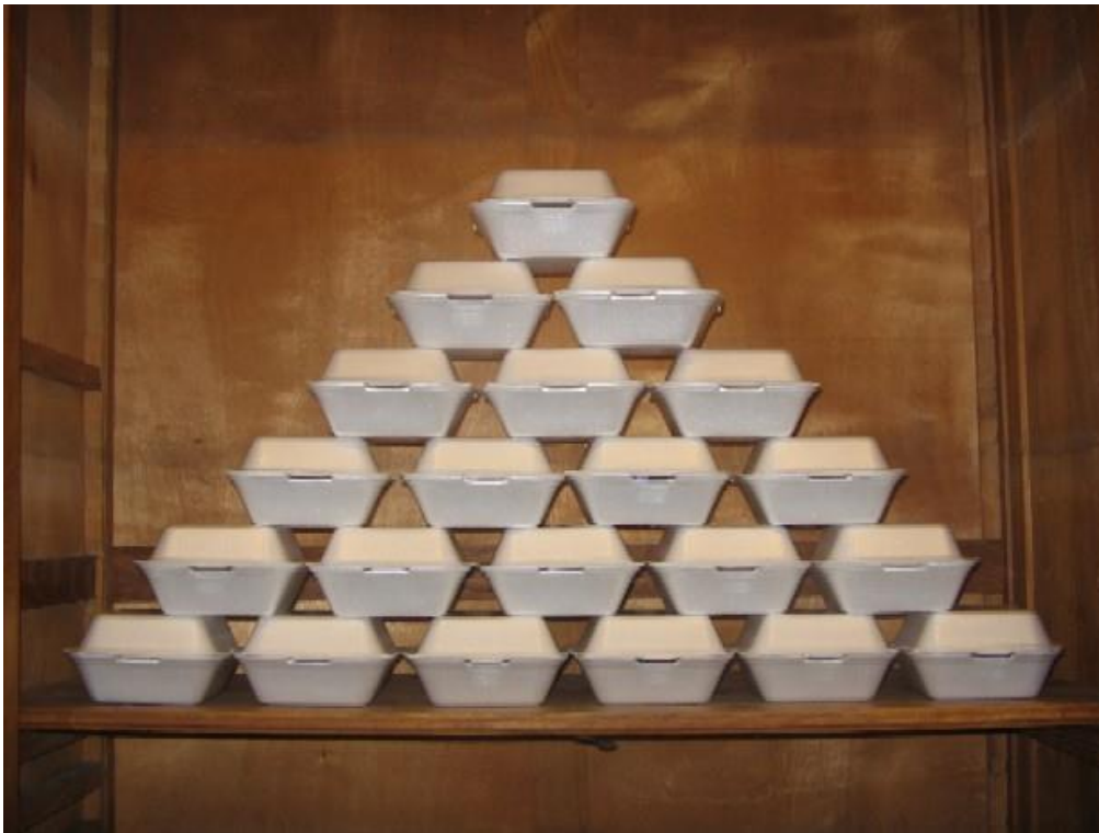
Pa comer aparte. Imágenes