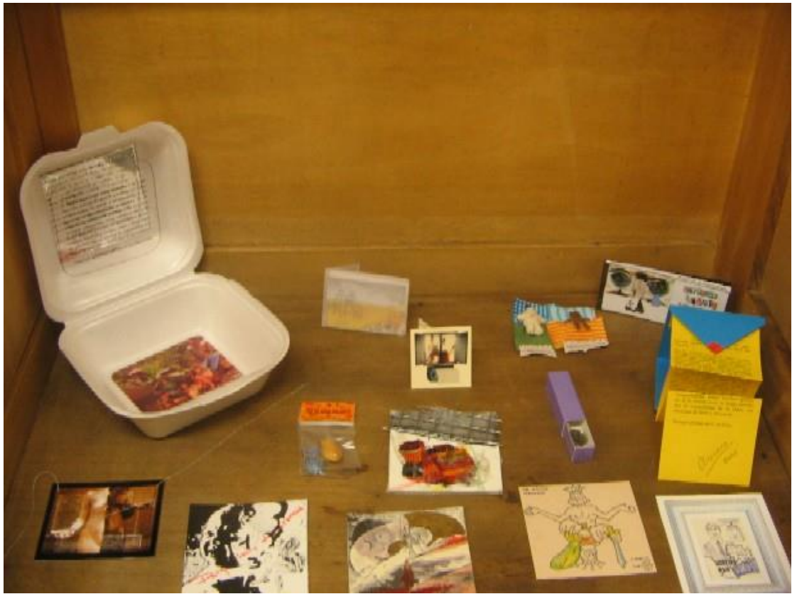
Pa comer aparte. Imágenes