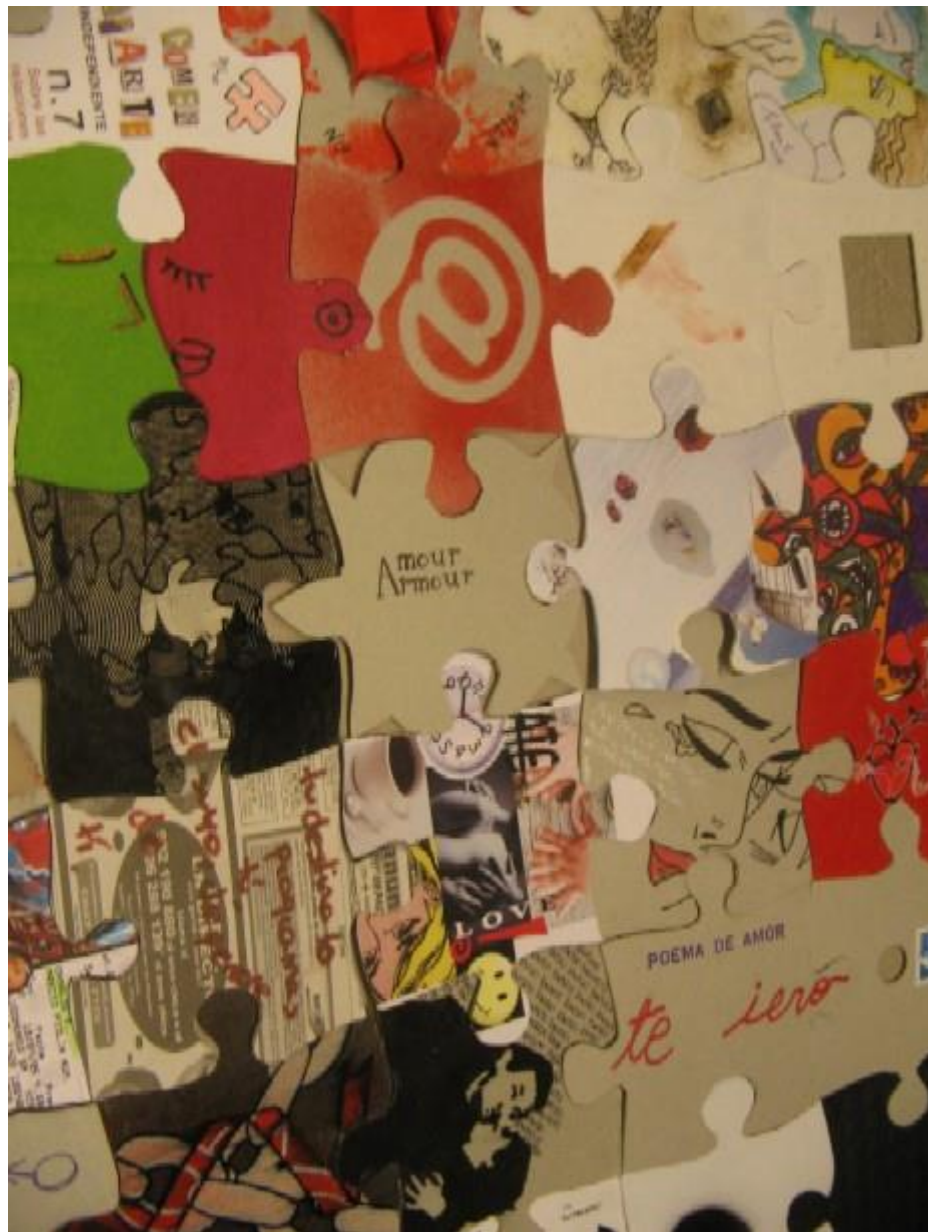
Pa comer aparte. Imágenes