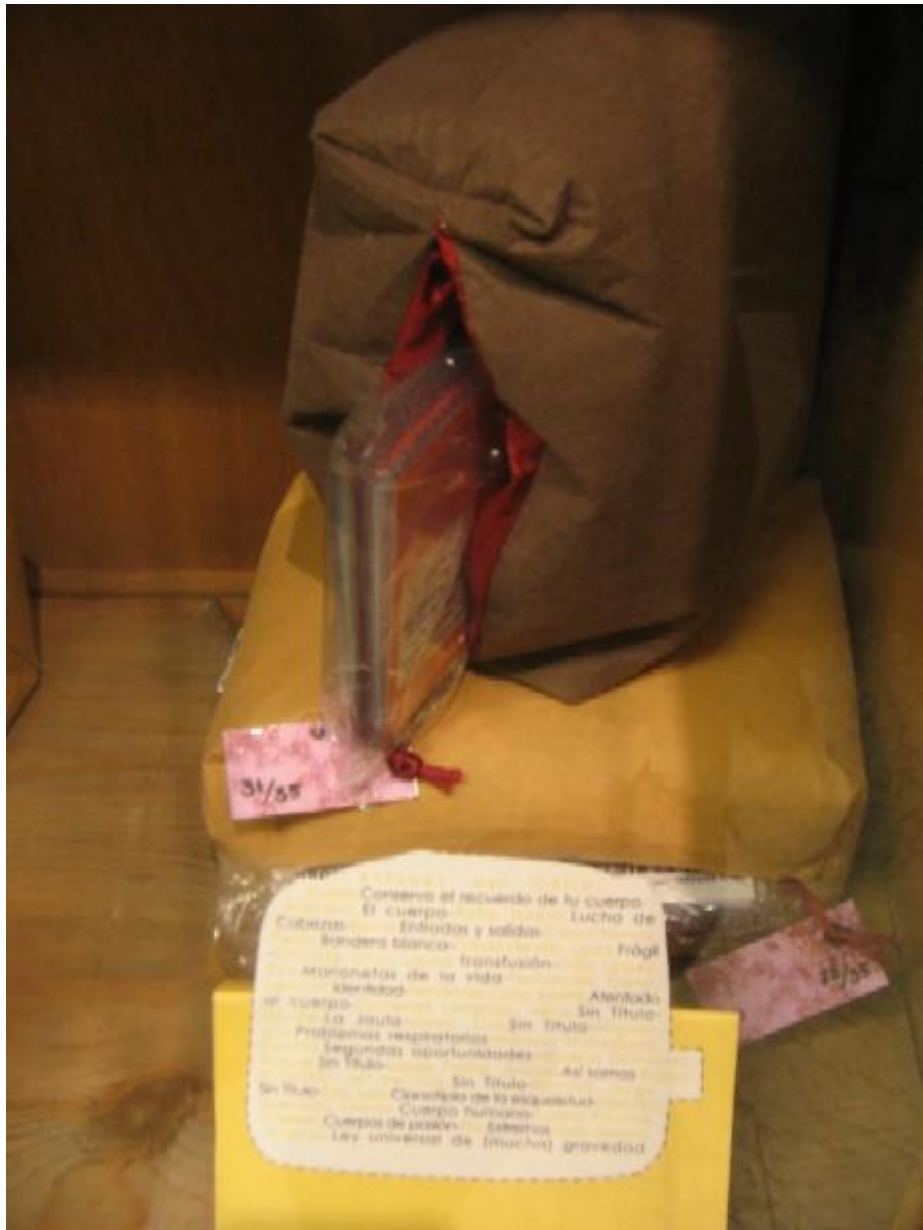
Pa comer aparte. Imágenes