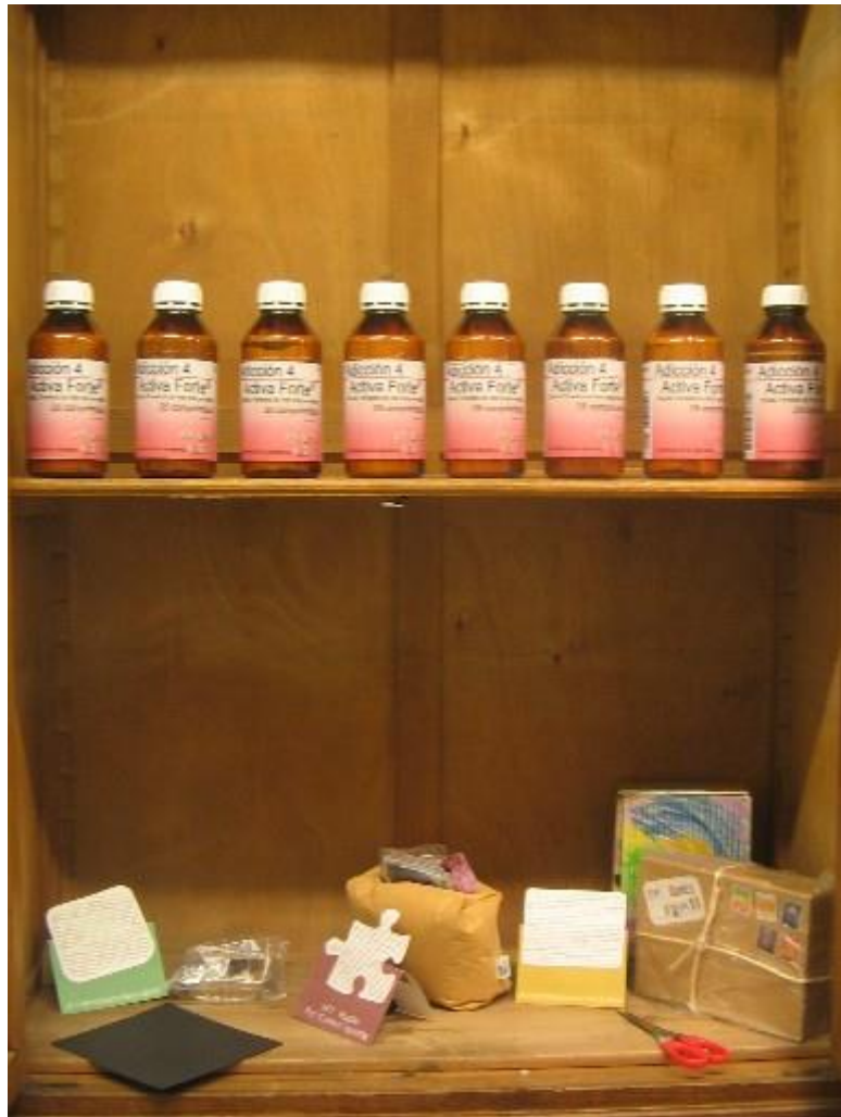
Pa comer aparte. Imágenes