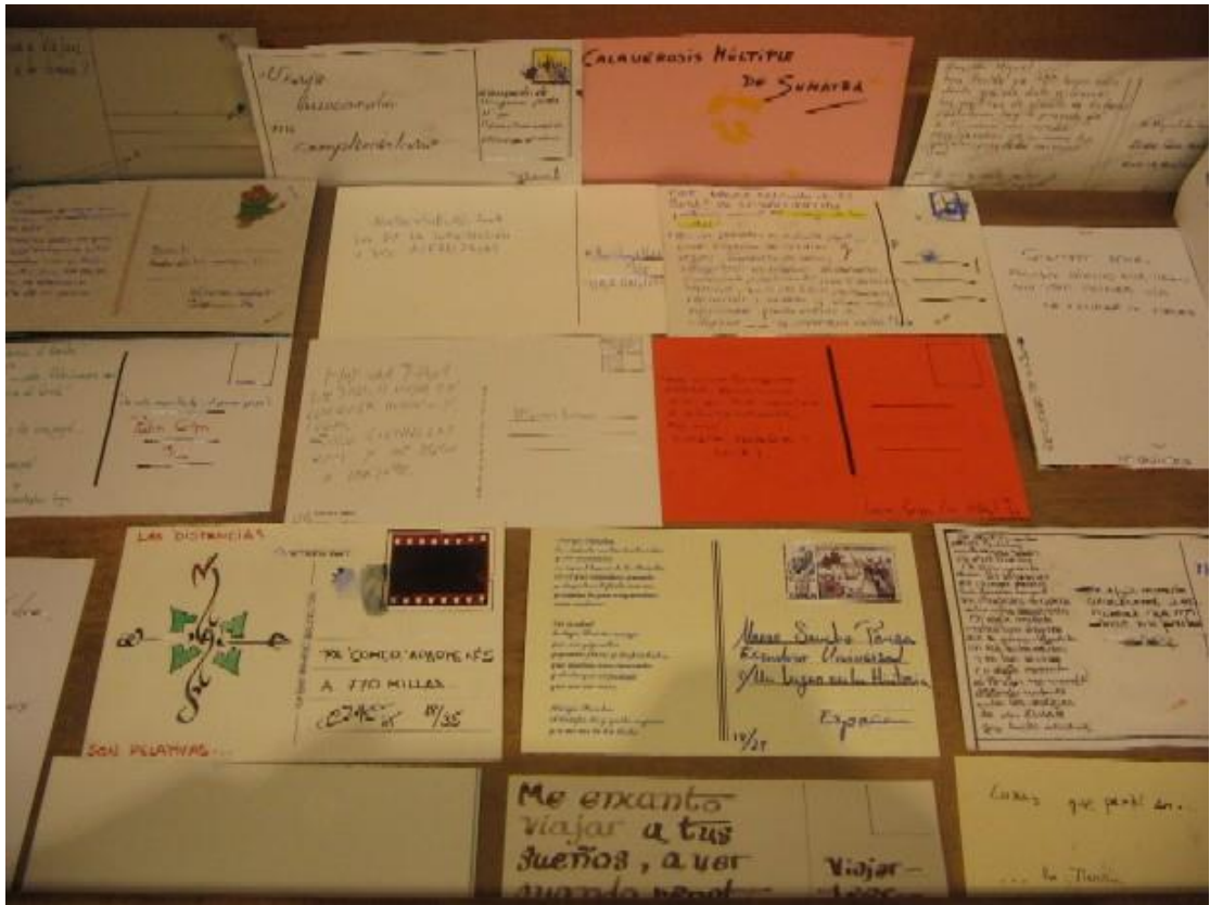
Pa comer aparte. Imágenes