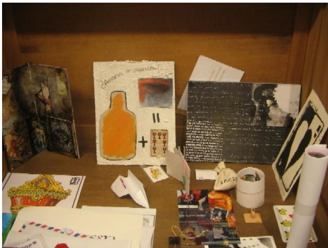
Pa comer aparte. Imágenes