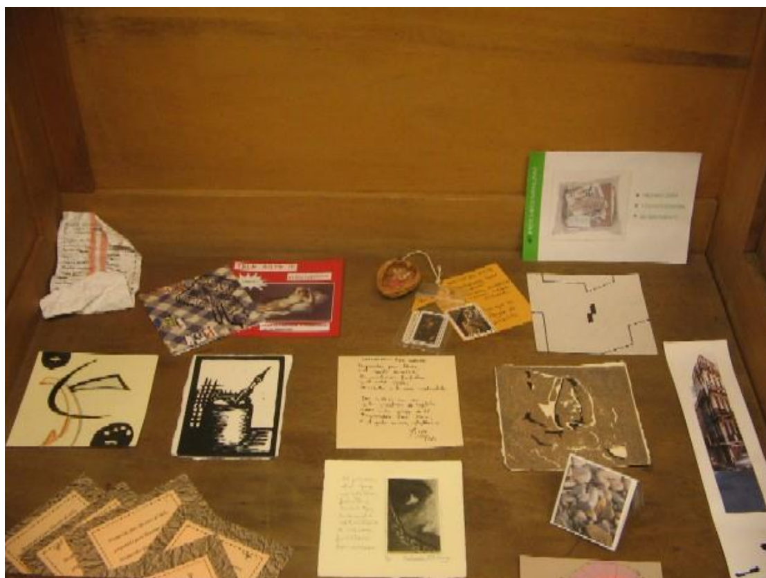
Pa comer aparte. Imágenes