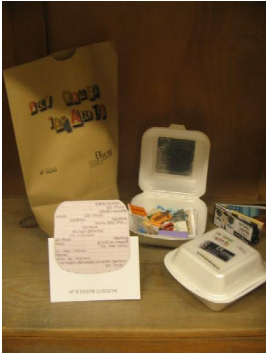
Pa comer aparte. Imágenes