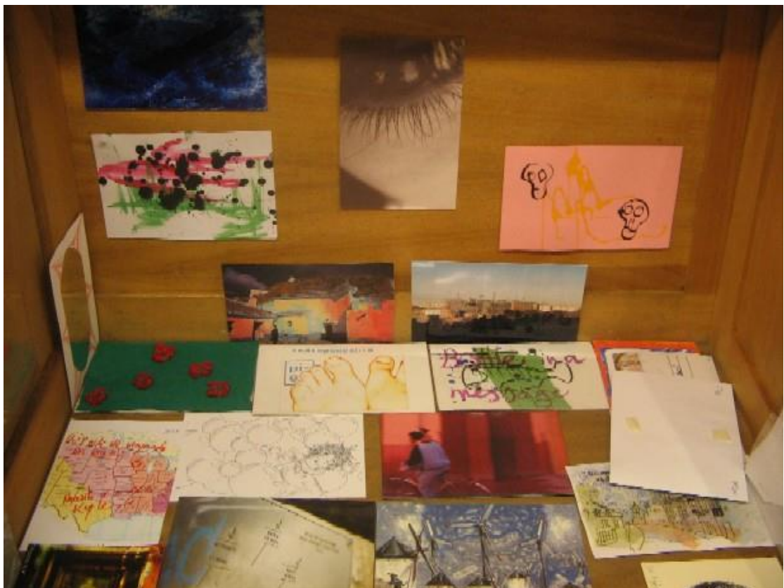
Pa comer aparte. Imágenes