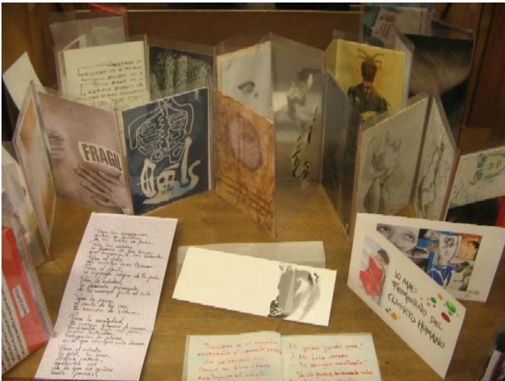
Pa comer aparte. Imágenes