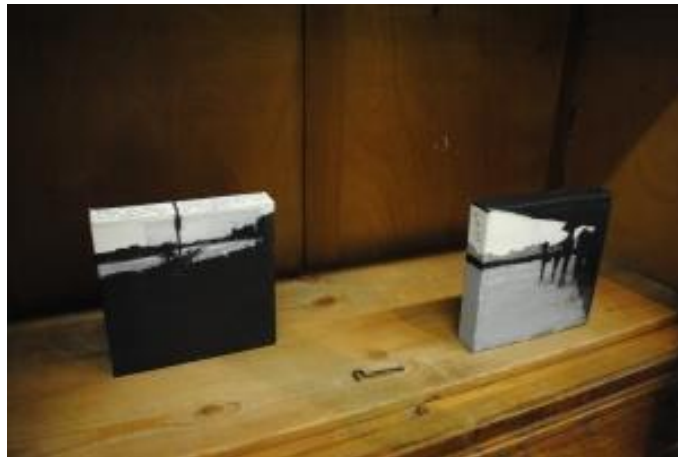
Guillermo Masedo 07