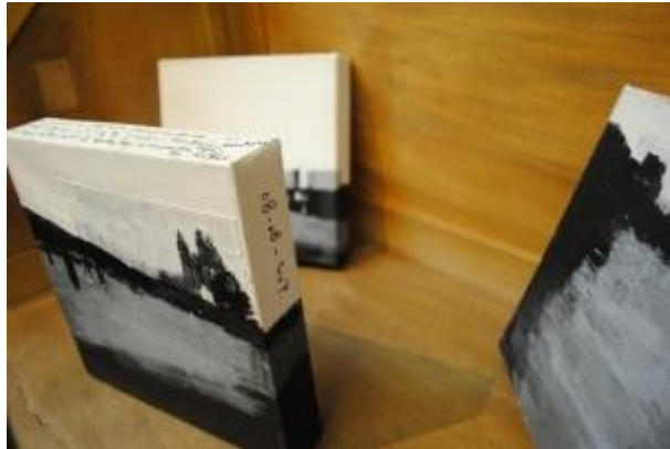
Guillermo Masedo 56