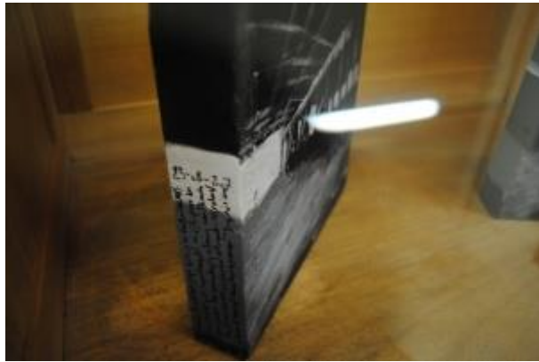
Guillermo Masedo 37