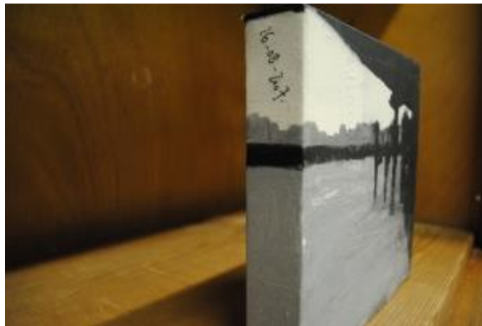
Guillermo Masedo 08