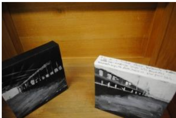
Guillermo Masedo 27