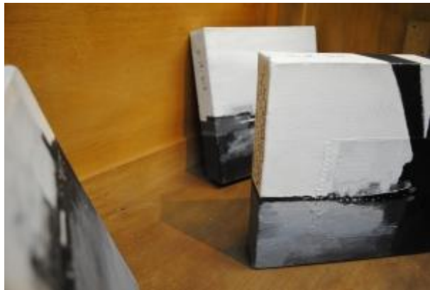
Guillermo Masedo 52