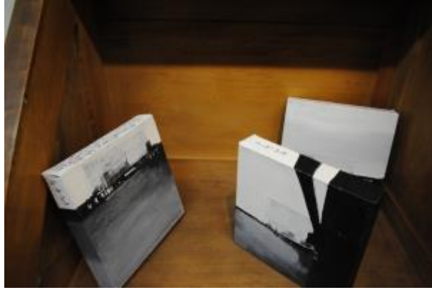
Guillermo Masedo 47