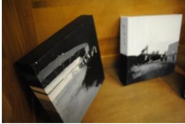
Guillermo Masedo 44