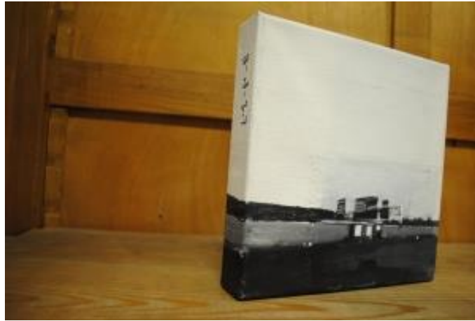
Guillermo Masedo 04