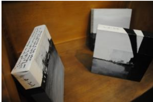
Guillermo Masedo 48