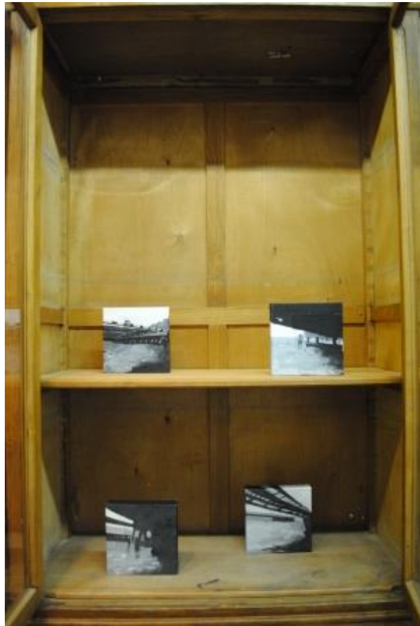
Guillermo Masedo 16