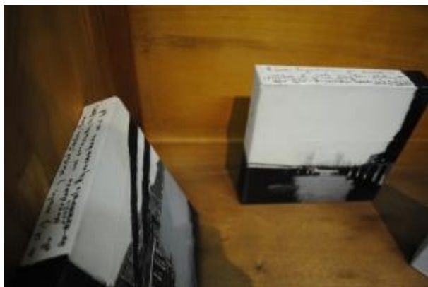
Guillermo Masedo 40