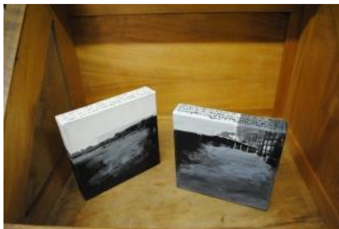
Guillermo Masedo 24