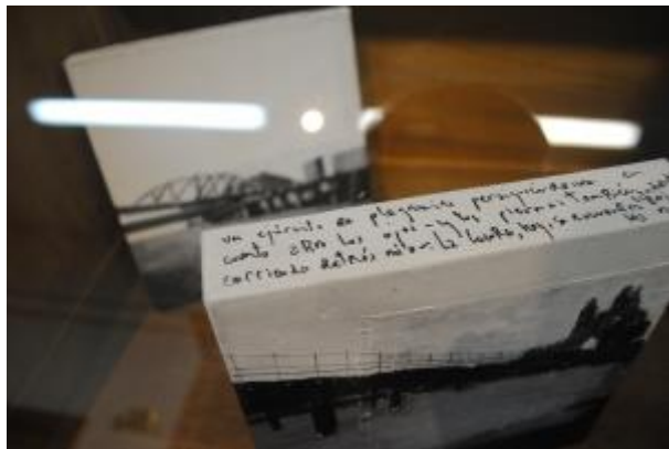
Guillermo Masedo 57