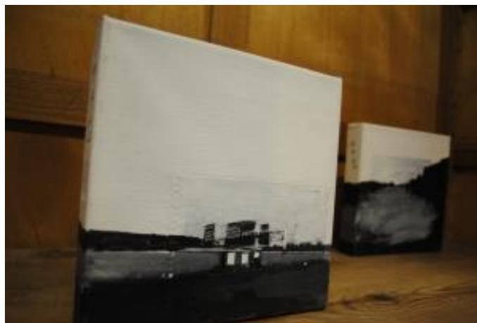
Guillermo Masedo 06