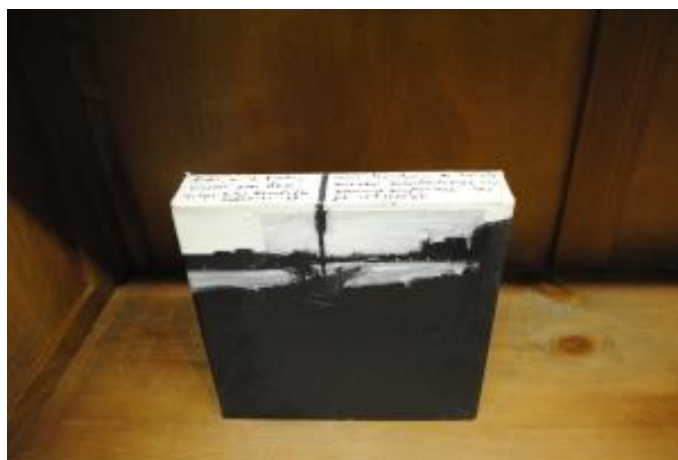
Guillermo Masedo 09