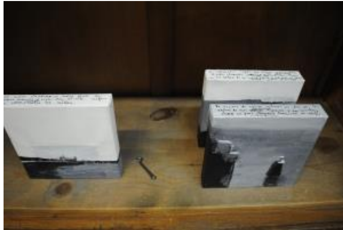
Guillermo Masedo 20