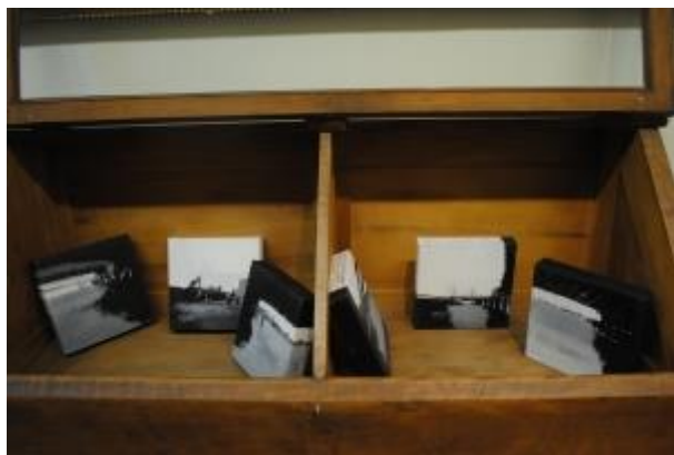
Guillermo Masedo 37