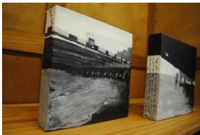
Guillermo Masedo 12