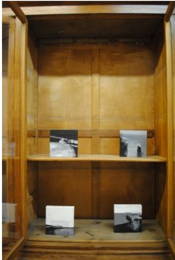
Guillermo Masedo 22