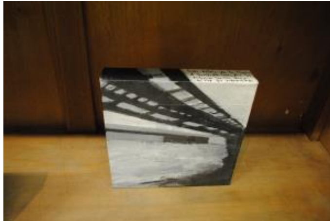
Guillermo Masedo 13