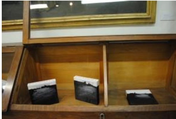
Guillermo Masedo 32