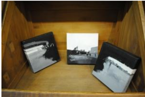
Guillermo Masedo 39