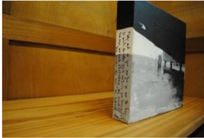
Guillermo Masedo 10