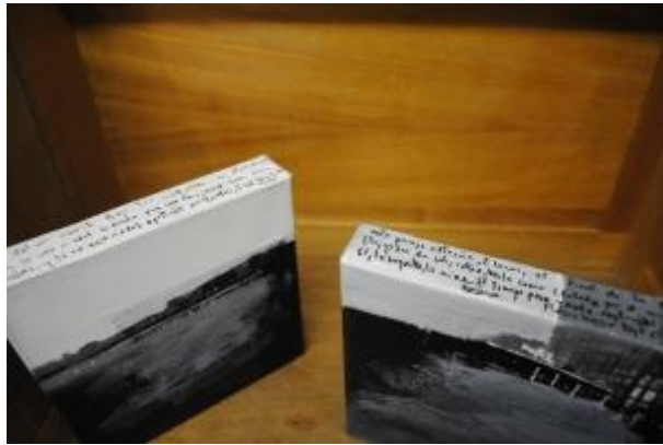
Guillermo Masedo 26