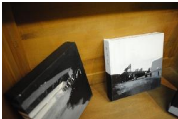
Guillermo Masedo 43