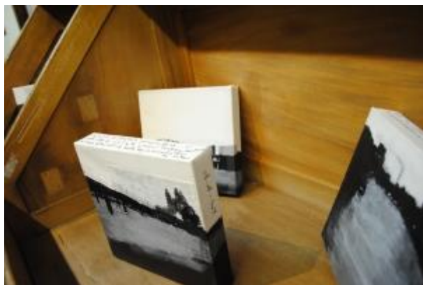
Guillermo Masedo 55