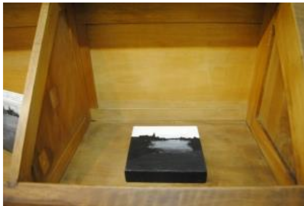
Guillermo Masedo 33