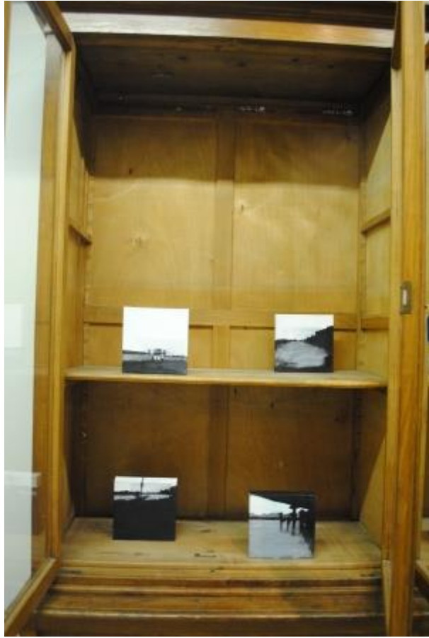
Guillermo Masedo 18