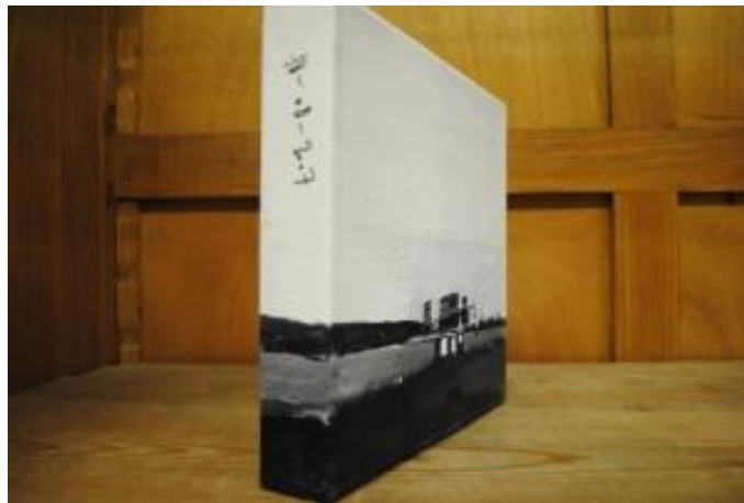
Guillermo Masedo 05