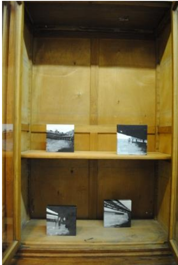
Guillermo Masedo 17