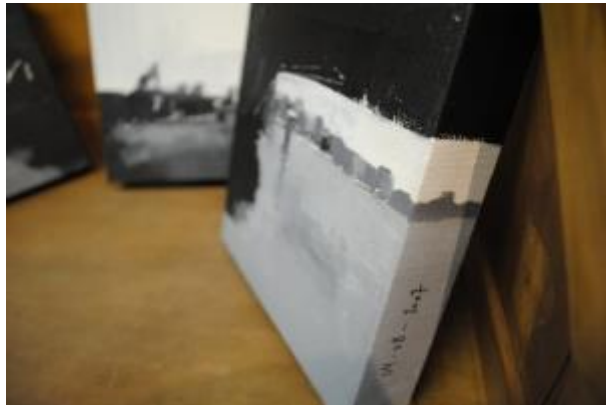
Guillermo Masedo 42