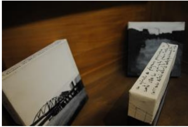
Guillermo Masedo 53