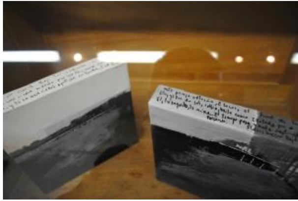
Guillermo Masedo 36