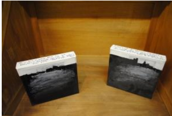
Guillermo Masedo 28