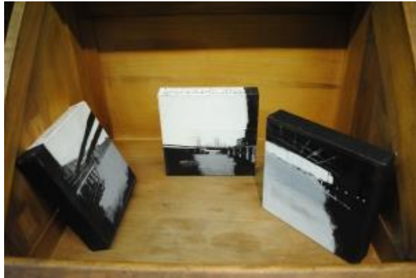
Guillermo Masedo 38