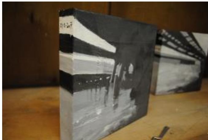
Guillermo Masedo 14