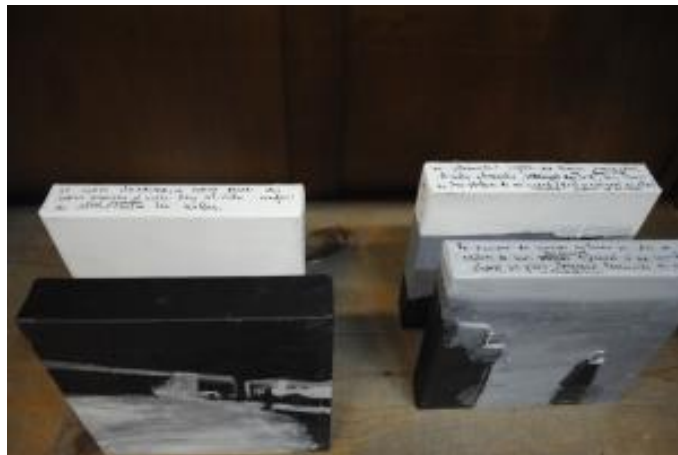
Guillermo Masedo 21