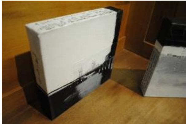
Guillermo Masedo 41