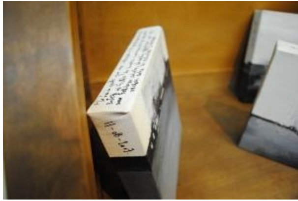
Guillermo Masedo 50