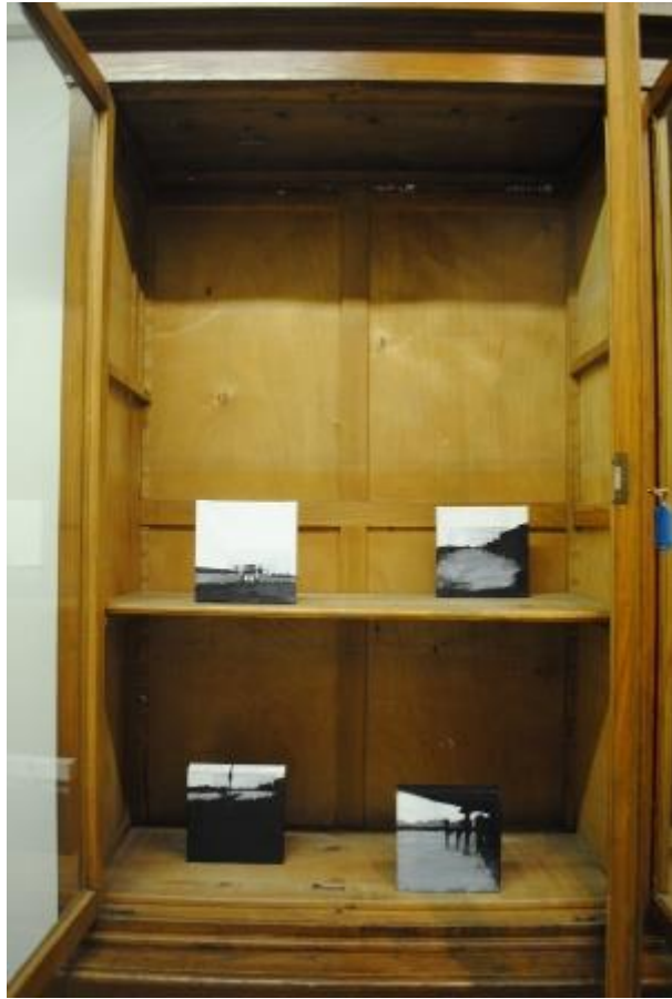
Guillermo Masedo 15