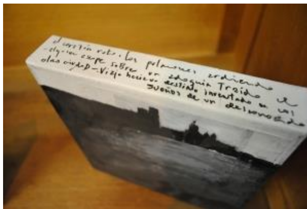
Guillermo Masedo 30