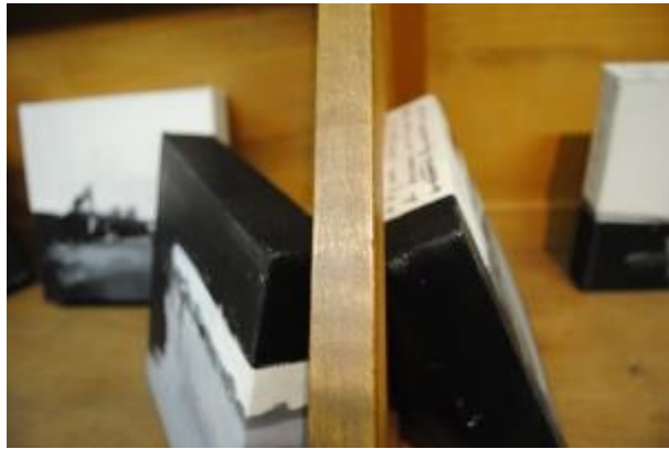
Guillermo Masedo 45