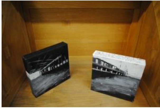
Guillermo Masedo 25