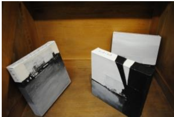
Guillermo Masedo 46