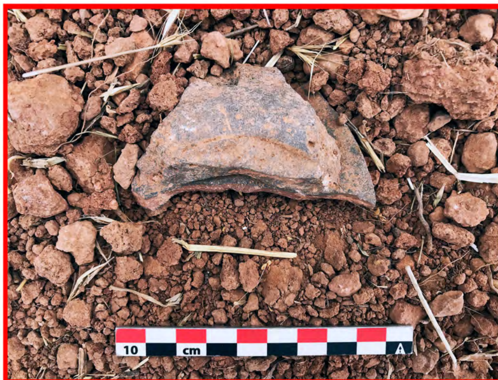
Figura 1. 1. Localización de la zona de hallazgo del fragmento de fallo de cocción en la villa de Puente de la Olmilla (Albaladejo). José Luis Fuentes Sánchez/OPPIDA.