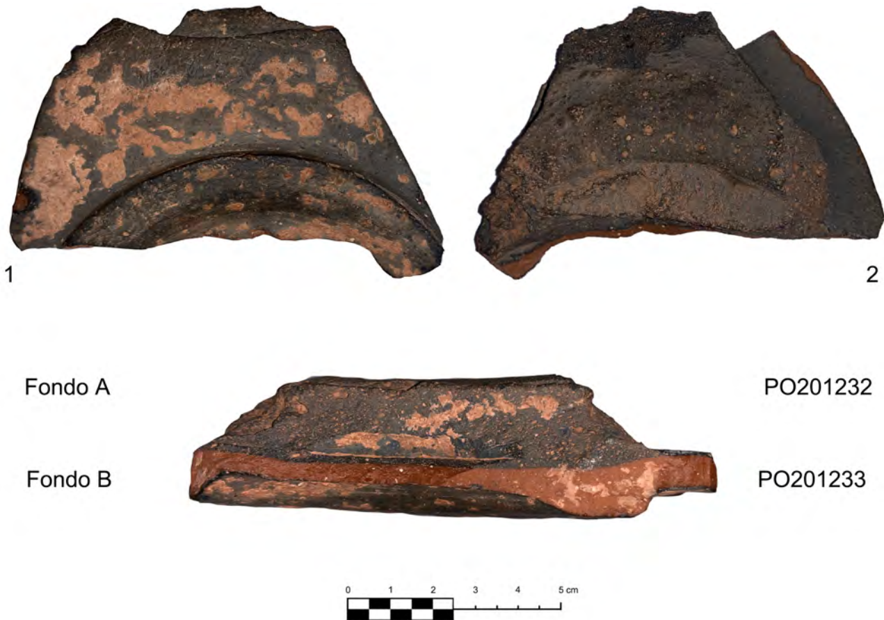
Figura 2. Fragmento de fallo de cocción PO201232 y PO201233.

que inducen a pensar en un escenario productivo de cerámicas comunes y materiales de construcción en este establecimiento rural. En los trabajos de limpieza de una de las parcelas afectadas por la presencia de restos constructivos de la villa, fue hallado un interesante fragmento cerámico consistente en un fallo de cocción. El fragmento presenta fusionadas dos piezas cerámicas, que se corresponden con sendos cuencos de la Forma 37 tardía que debieron ser apilados en el horno, y que por una sobreexposición calórica se deformaron.