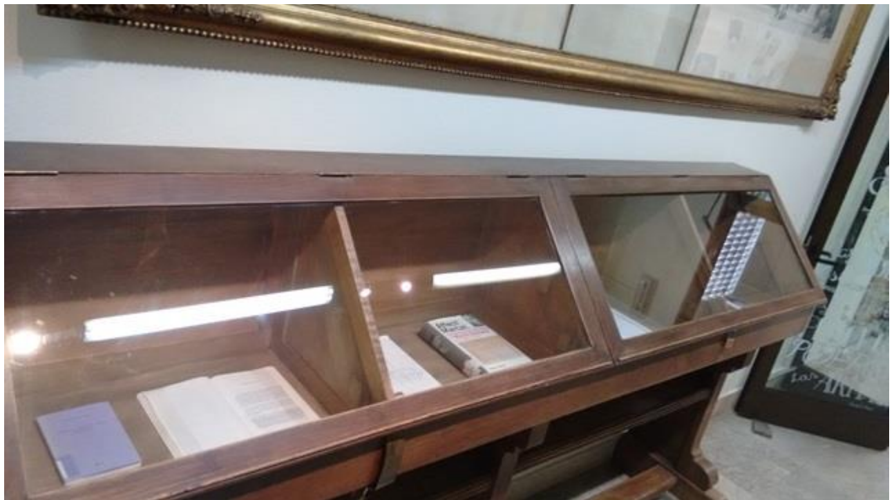
Biblioteca de Bellas Artes