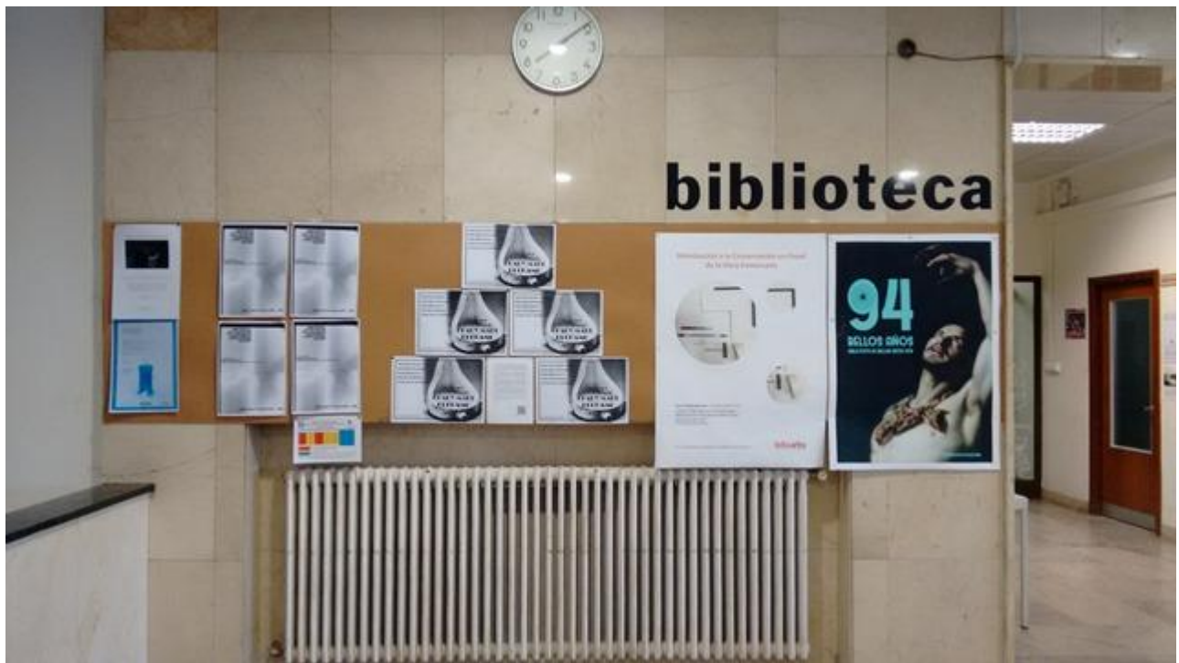
Biblioteca de Bellas Artes. Hall de entrada