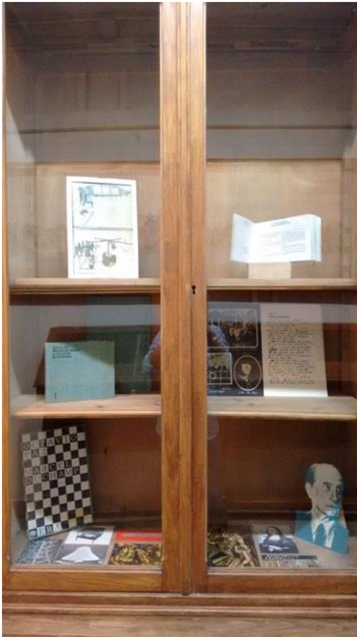
Biblioteca de Bellas Artes