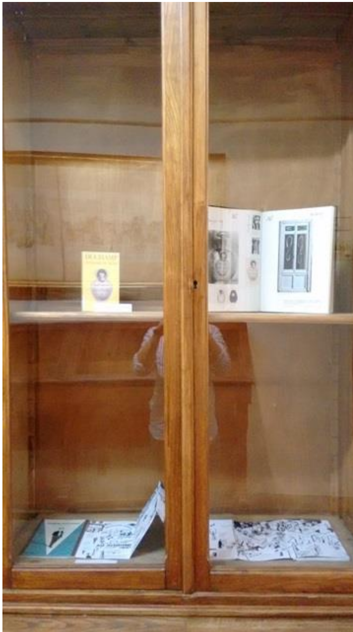
Biblioteca de Bellas Artes