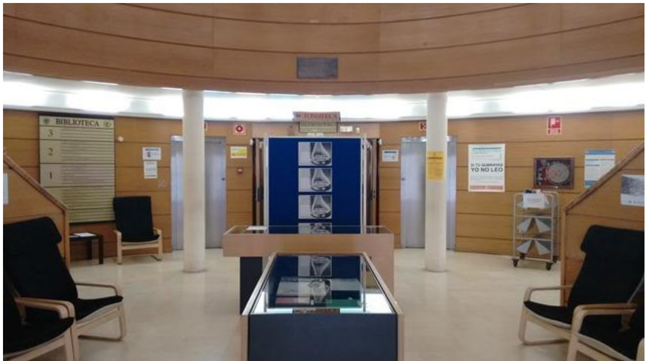
Biblioteca de Geografía e Historia