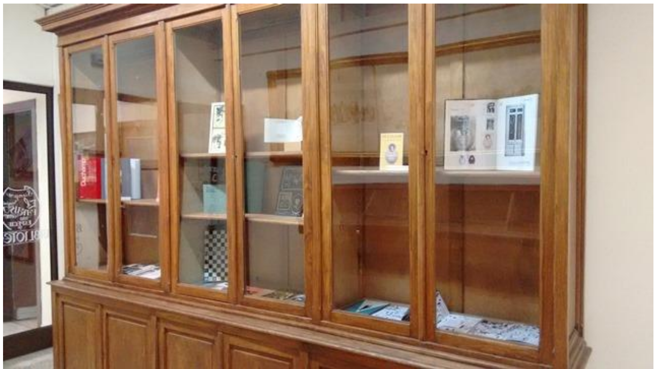
Biblioteca de Bellas Artes. Vista general de las vitrinas de la antigua Biblioteca de la Escuela de Bellas Artes de San Fernando