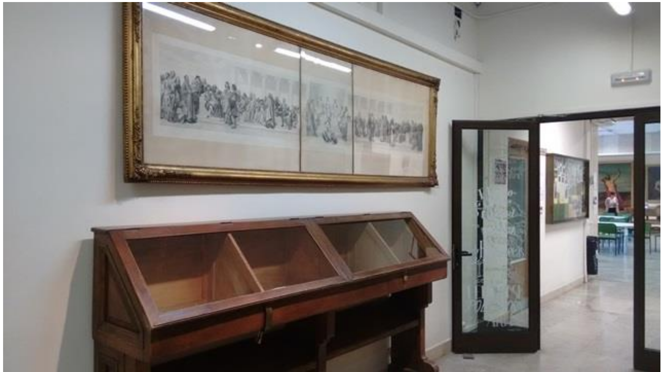
Biblioteca de Bellas Artes