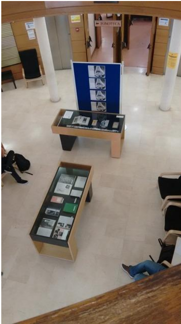
Biblioteca de Geografía e Historia