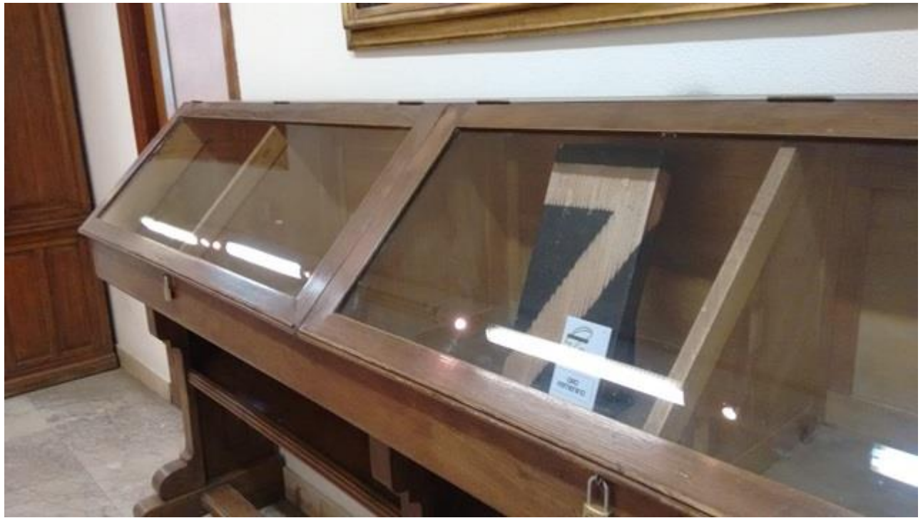
Biblioteca de Bellas Artes