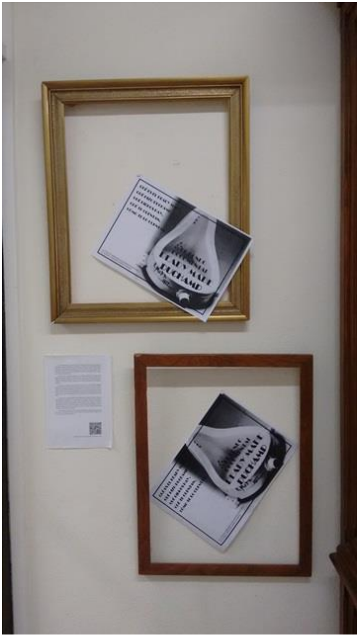
Biblioteca de Bellas Artes