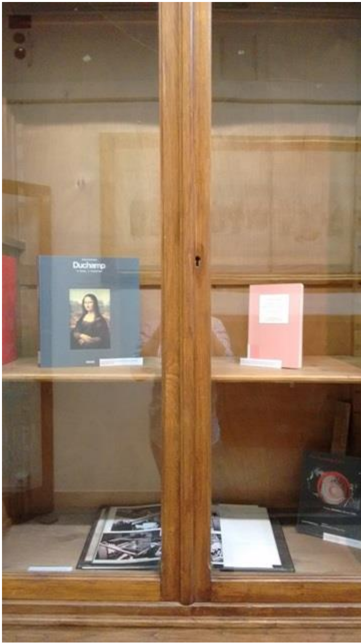
Biblioteca de Bellas Artes