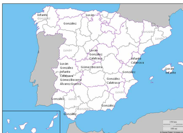
Figura 1. Resultados electorales de los progresistas extremeños. 1833-1868

Elaboración propia. (En negrita, provincias en las que fueron elegidos)