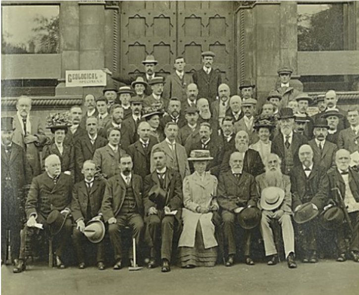
Figura 1. La paleontóloga inglesa Gertrude Elles, sentada en primera fila, en la reunión de la British Association (Asociación Británica para el avance de la Ciencia) celebrada en Dublín en 1908.

siglo XIX de fósiles de vertebrados e invertebrados jurásicos en la localidad de Lyme Regis, en la costa inglesa del Canal de la Mancha. A pesar del reconocimiento actual hacia su labor pionera, Anning tuvo que sufrir la incomprensión de sus contemporáneos (TORRENS, 1995). Si bien, afortunadamente, hubo excepciones de mujeres que disfrutaron de la complicidad y del apoyo de hombres, profesores o maridos, lo que les permitió desarrollar tanto su afición a coleccionar fósiles con un criterio científico, como a desarrollar una carrera investigadora. De la primera actividad, y por ser poco conocida, nos gustaría mencionar a Lady Eliza María Gordon Cumming, contemporánea de Anning, una de las pioneras en la formación de colecciones paleontológicas. Esta aficionada escocesa recolectó durante los años veinte del siglo XIX un extraordinario conjunto de peces fósiles en las canteras de la región de Moray Firth, en la costa nororiental de Escocia, que fueron decisivas para atribuir la Old Red Sandstone al Devónico. Sus colecciones fueron estudiadas por el naturalista suizo y reconocido ictiólogo Louis Agassiz, quien identificó nuevas