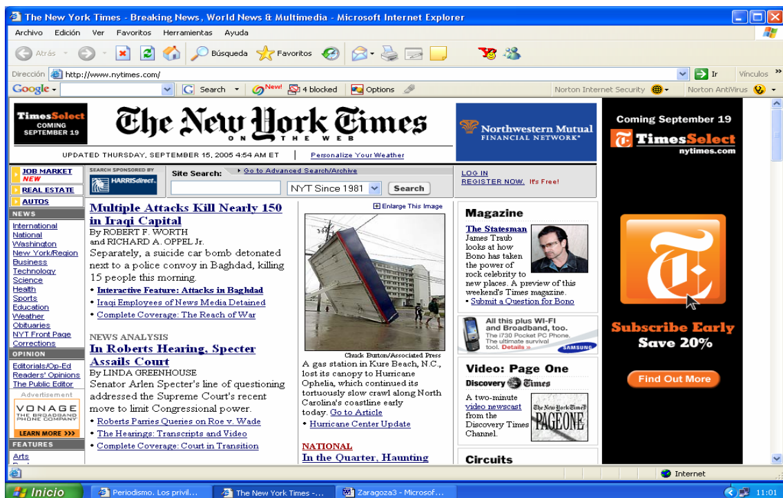
Figura 8. Nuevo servicio de información desde el Archivo de este periódico.