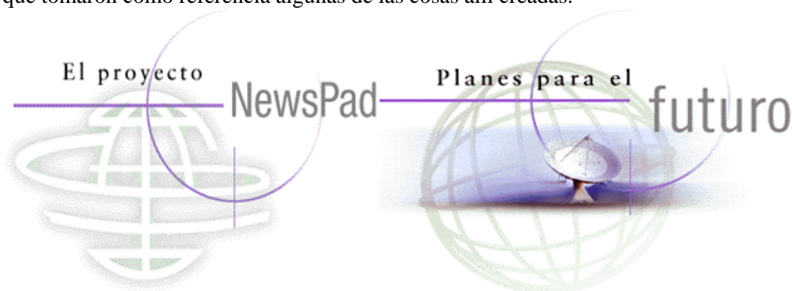
Figura 2. Algunas de las propuestas realizadas en el proyecto NewsPad.

En este Proyecto, los “hermanos” de El Periódico fueron Acorn Computer (de Cambridge), quien se encargó de suministrar de tecnología; la firma francesa Carat, intermediaria de las empresas publicitarias con una fuerte implantación en Europa, que lleva el control del impacto de la publicidad sobre los usuarios; el Institut Català de Tecnologia , que aporta apoyo técnico y resuelve las consultas sobre telecomunicaciones y la empresa griega Archimedes Ltd. Este Proyecto ofrece sobre todo una nueva forma de plantear la información, buscar recursos para gestionarla –publicidad– y mostrar el camino a la tecnología necesaria para hacerlo y recibirlo. Si bien, el proyecto se quedó en eso, un proyecto, luego sirvió como referente para otros muchos periódicos digitales que tomaron como referencia algunas de las cosas allí creadas.