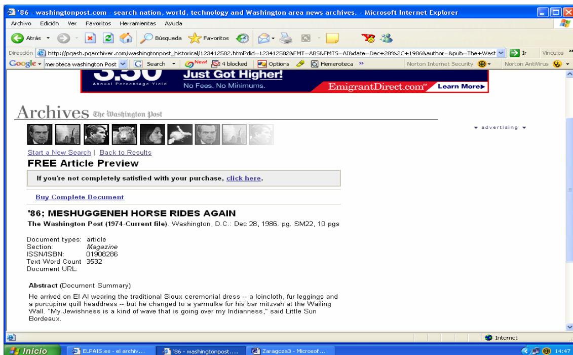
Figura 7. Resultados de una búsqueda en los archivos The Washington Post.

Son aún pocos los periódicos españoles que ya han digitalizado todos sus fondos. Por contra, en Estados Unidos hay varios medios que apuestan por el Archivo como una fuente más de ingresos, sobre todo desde que Internet se convirtió en el lugar de trabajo de muchos profesionales que demandan información y que con anterioridad iban a consultar estos datos a las bibliotecas y centros de documentación.