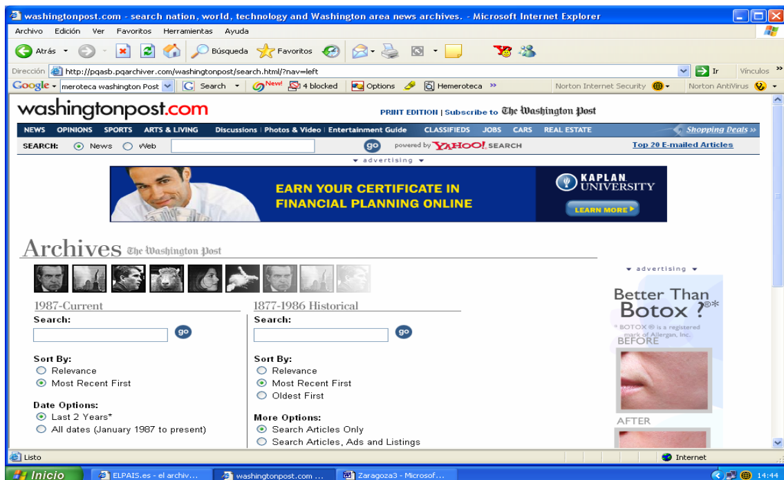
Figura 6. Archivo The Washington Post que separa búsquedas actuales de históricas.

Por supuesto, la mayoría de los archivos de prensa digital disponen de potentes motores de búsqueda que ofrecen en unos segundos una búsqueda efectiva. Los resultados pueden presentarse mediante texto completo de todos los artículos buscados o con un resumen de contenidos, más datos bibliográficos y un enlace al texto completo, éste ya de pago, como se muestra en la mayoría de los periódicos norteamericanos que desde hace un lustro comercializan sus fondos de Internet. Por su puesto, se puede acotar la búsqueda temporal, por fechas concretas y diferenciar entre lo más reciente y lo pasado como se puede constatar en la figura 6.