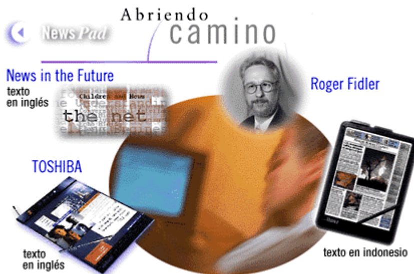
Figura 3. Diferentes formas de tratar la información en un formato digital.

un estudio comparativo con los contenidos actuales. Las informaciones apenas seguían un orden dentro de la portada, ya que ésta presentaba una configuración multifuncional, en la que la publicidad y las imágenes se convertían en el centro de la información. Como entonces no había una infraestructura informativa creada y la actualización de la información no se hacía. Las primeras informaciones digitales tenían la misma duración que la de los periódicos impresos, es decir, una única edición duraba todo el día. Con posterioridad, se fue recortando ese tiempo y se pasa a ofrecer una o dos actualizaciones, hasta la llegada de las informaciones en tiempo real, ya metidos dentro del siglo actual. Ahora, la competencia no es tan solo llegar el primero sino dar varias versiones de la misma información, completar las diversas vertientes que puede presentar una información.