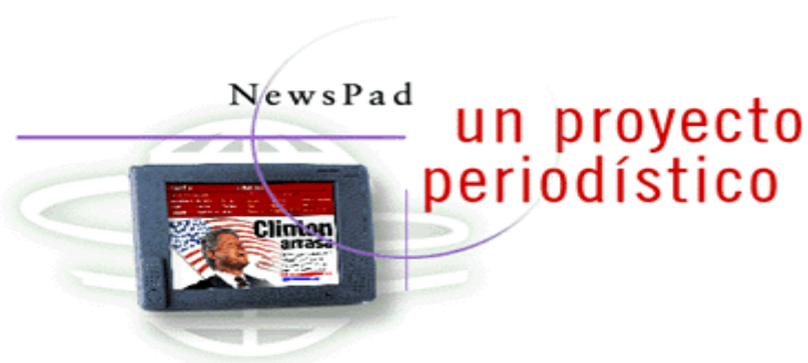
Figura 1: Proyecto NewsPad en el que participó El Periódico de Catalunya .