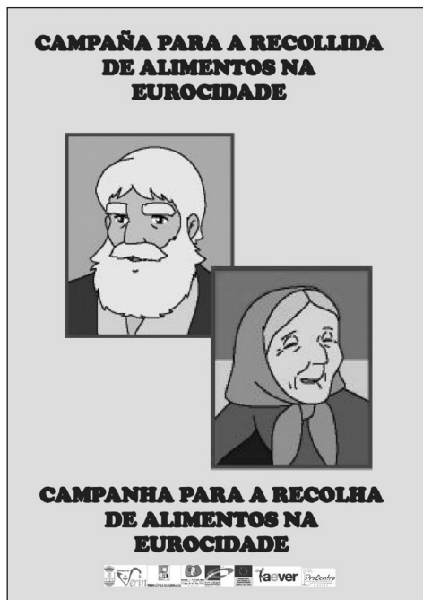
Figura 3 CARTEL QUE ANUNCIA UNA RECOGIDA DE ALIMENTOS PROMOVIDA POR LA EUROCIUDAD, DENTRO DE LAS ACTIVIDADES NAVIDEÑAS