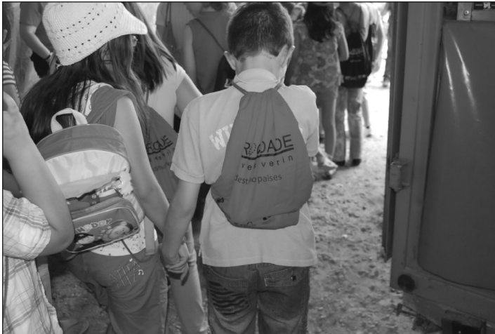
Figura 2 MATERIAL DISTRIBUIDO POR LA EUROCIUDAD EN ACTIVIDADES INFANTILES