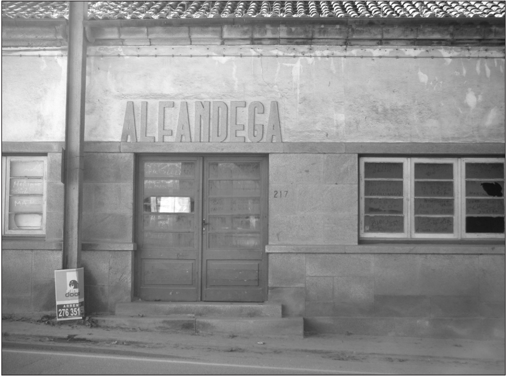
Figura 4 ANTIGUO EDIFICIO DE ADUANAS EN VILAVERDE DA RAIÁ (CHAVES)

Fotografiada por la autora el 10 de febrero de 2011.