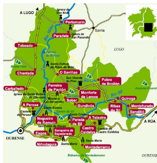
Mapa 1. Delimitación territorial de la Ribeira Sacra

La expresión "Rivoira Sacrata" es citada por el Padre Flórez en su España Sagrada , ya en siglo XVIII, tomándola de Antonio Yepes, quien a inicios del XVII se refiere a ella en su Crónica General de la Orden de San Benito , tomándola, a su vez, de un escrito fundacional de la Abadía de Montederramo (Fernández Castiñeiras, 2010: 314). El nombre responde a la cantidad de monasterios, iglesias, ermitas y cenobios que jalonan los meandros de parte del río Cabe y, en especial, del Sil, monasterios que posteriormente se fueron extendiendo a una parte de la Ribera del Miño, por tener una orografía parecida. Ese conjunto circunscribe el espacio geográfico designado por el nombre actual de Ribeira Sacra. Es bastante probable que el atributo "sacra" que forma parte del nombre indique algo mucho más antiguo que los edificios cristianos que alzaron en el territorio. Más aún, es posible que su asentamiento en ese lugar se debiera al deseo de incorporar creencias populares ancestrales dentro de la fe cristiana, que se manifestaba en todo su esplendor mediante construcciones religiosas, de las cuales hoy se conserva el muy importante legado del arte románico de sus distintas iglesias.