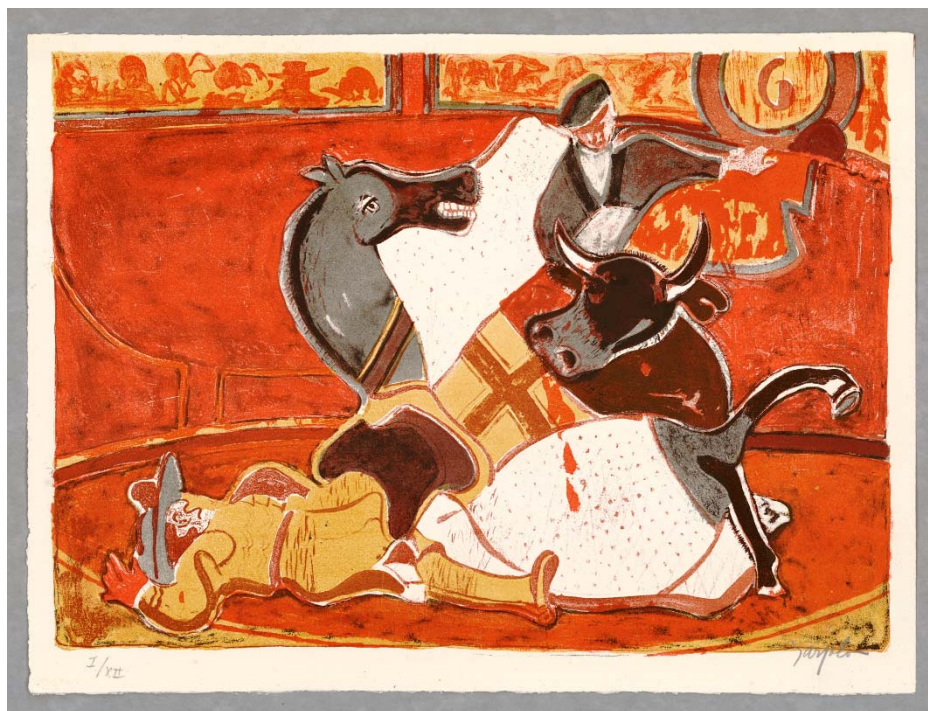
Fig. 2 Tauromaquia , 1970. Litografía de Juan Barjola. Obra preferida de Alfonso Utrilla

inclinaron por el blanco y negro. Se utilizaron varias técnicas de grabado. Rafael Díaz-Casariego adquirió en 1964 para su taller una prensa litográfica, motivo por el que los grabados de los títulos iniciales fueron estampados únicamente con esta técnica. Pero más tarde, en 1972, incorporó dos tórculos y una prensa vertical que permitieron el empleo de técnicas y procedimientos de grabado más diversos y ampliar, de paso, la posibilidad de solicitar la colaboración a otros artistas (García-Ochoa, 1998). Así, ese mismo año, Luis García-Ochoa en Campos de Soria , fue el primero que combinó estampas litográficas y al aguafuerte. En 1977 Javier Clavo introdujo en Un hidalgo la técnica de la punta seca y con Xilografías de Francisco Bores aparece el grabado en madera. Al año siguiente, en 1978, Andrés Barajas combinó en Sonetos el aguafuerte y la aguatinta y, a partir de entonces, los artistas invitados compaginaron indistintamente las diferentes técnicas, según su predilección. En el taller todos los grabadores realizaron sus matrices directamente, sin otras personas interpuestas (salvo en el caso de Francisco Bores fallecido en 1972) algo que destacó siempre Rafael Díaz-Casariego. Para las estampaciones los artistas contaron con el apoyo de reputados artesanos especializados como Manuel Repila, para la prensa litográfica, y de Silvino Poza, Dietrich Mann y, sobre todo de Pedro Arribas, para los procedimientos calcográficos (García-Ochoa, 1998).