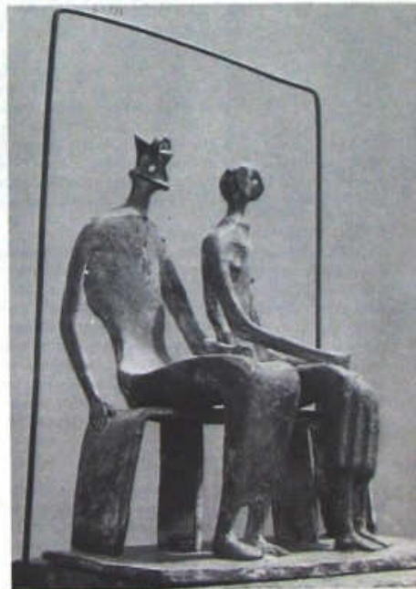
Maqueta de Rey y Reina, 1952