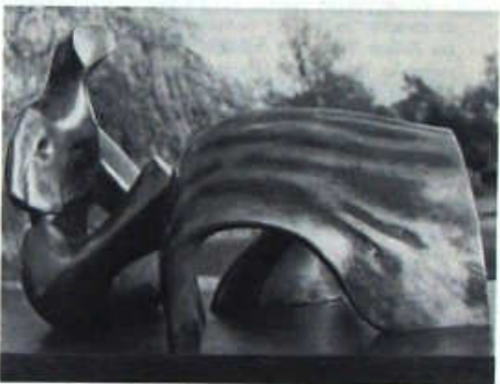
Figura reclinada en tres piezas: Vestida, 1975

"La escultura es un arte para el aire libre. La luz del día, la luz del sol le es necesaria, y para mí su mejor emplazamiento y complemento es la naturaleza. Yo prefiero tener una pieza de mi escultura colocada en un paisaje, prácticamente en cualquier paisaje, antes que dentro de o sobre el más bello edificio que yo conozca".