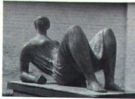
Figura reclinada vestida, 1952-53

No pocas veces, por último, Moore adopta un estilo en el que las