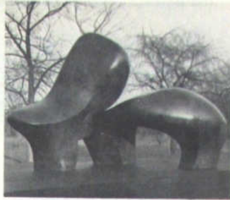
Modelo para Ovejas, 1971

1983. Con la importantísima Exposición Retrospectiva de Esculturas, Dibujos y Grabados que el Museo de Arte Contemporáneo de Caracas dedica al artista (entre el 8 de marzo y el 22 de mayo) en sus espacios internos y en zonas exteriores aledañas al Museo, culmina la fecunda y abierta trayectoria recorrida hasta el presente por Henry Moore.