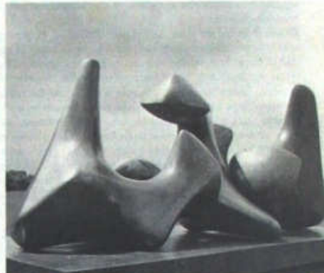
Modelo para Escultura en tres piezas: Vértebras, 1968

(H. MOORE, citado por E. Rodó, Diálogos en Arte , Secker and Warburg, London, 1961).