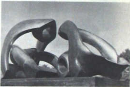
Modelo para Arcos de colinas, 1972

"El hombre común, con muy poco tiempo disponible para ver escultura y pintura, al mirar escultura como la mía, hallará dicha obra enigmática y extraña. (...) Pienso (...) que todo buen arte exige un esfuerzo del observador, y que debería exigir la expansión de sus experiencias vitales".