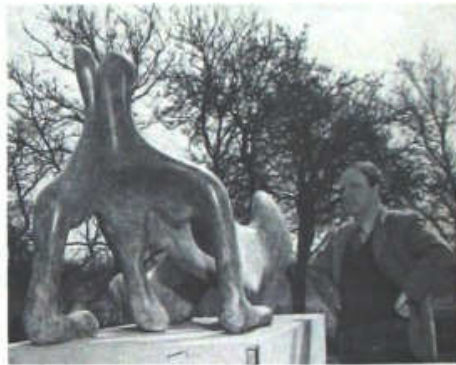
Moore ante su Figura reclinada , 1951