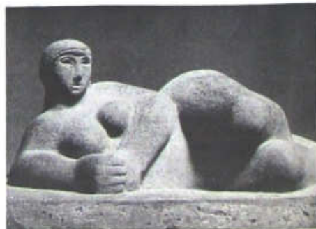
Figura reclinada (yes) , 1926