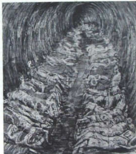
Perspectiva del Refugio del Metro. La extensión de la calle Liverpool, 1941.

(H. MOORE, citado por Curtin Lake, "Henry Moore's World", Artists Monthly , vol. 206, n. 1, Boston, 1962).